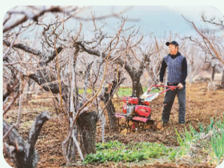
▲ 山东省青州市石门山街道朱家村农民在桃园里翻耕土地。