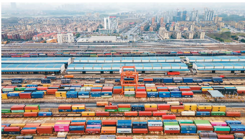
日前，浙江省金华市华东国际联运港，一列中欧班列正在铁路金华南站海关监管区进行装箱作业，准备装载110个标箱日用百货、电动工具、机械装备等货物启程驶往匈牙利布达佩斯。

有分析指出，在红海危机等地缘风险频发、全球物流和供应链遭受冲击的背景下，中欧班列的稳定器作用更加凸显。新加坡《联合早报》援引业内人士的话说，红