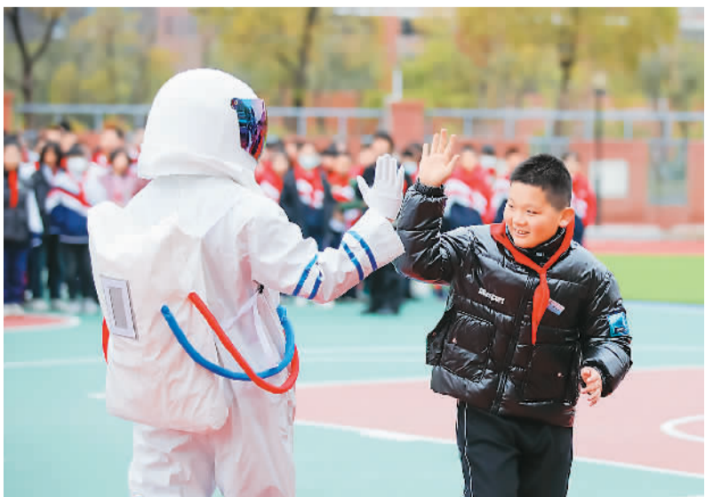
3月18日，“数致未来”科创公益活动在福建省福州市长乐区首占中心小学举办，学生们观看科学实验、参与互动游戏，近距离感受科技魅力。图为活动现场。