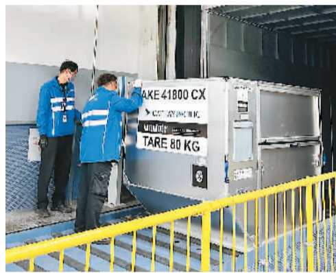
货运站人员检查装有医药品的控温航空箱。