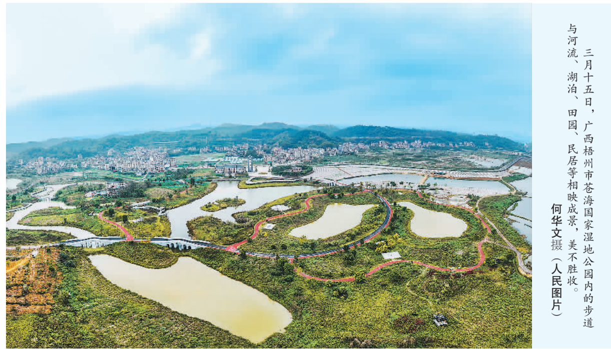
三月十五日,广西梧州市苍海国家湿地公园内的步道与河流、湖泊、田园、民居等相映成景,美不胜收。

强化河湖管理保护。推动河湖管理范围划界,划定133万公里河流、2057个湖泊的管控边界。七大流域重要河岸边线保护与利用规划全部批复实施。完成7280条河湖的健康评价,逐河逐湖建立健康档案,滚动编制实施“一河一策”方案7万多个。