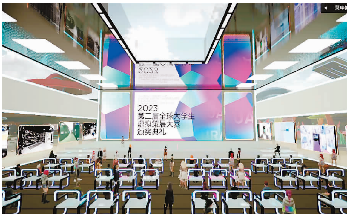
▲ 第二届全球大学生虚拟策展大赛云端颁奖典礼

在当前科技变革、产业更新的机遇中，教育数字化是具有重要意义的尝试。中央美术学院在教育数字化方面一直走在前列，虚拟策展实验项目、博物馆美育课程虚拟实验项目分别于2020年和2023年获评国家级虚拟仿真实验教学一流课程。以这两个项目为建设基础，中央美术学院联合十几所艺术高校和机构，共同搭建了国家级产学研平台——美术博物馆虚拟策展与美育课程虚拟教研室。