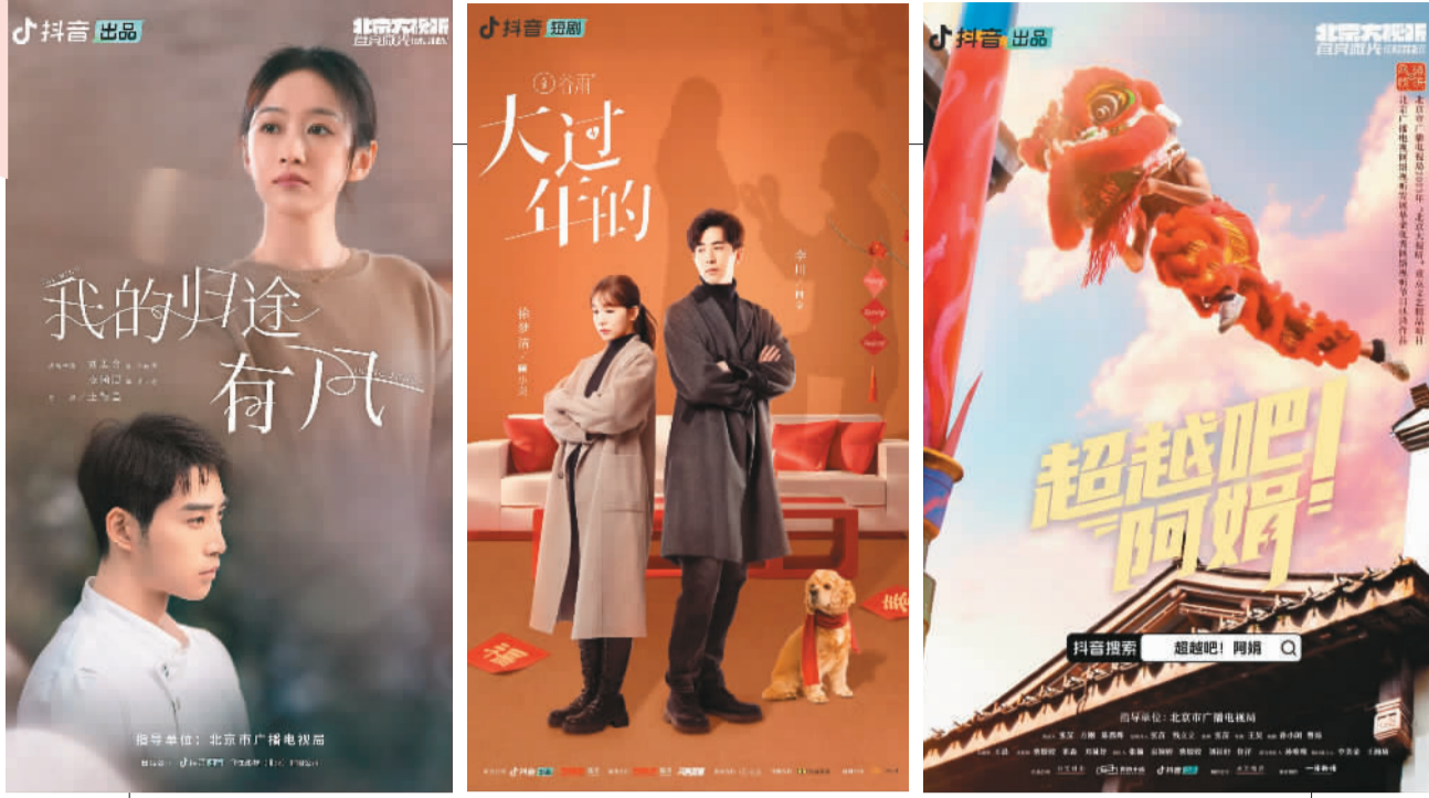
部分热播的春节档微短剧海报。