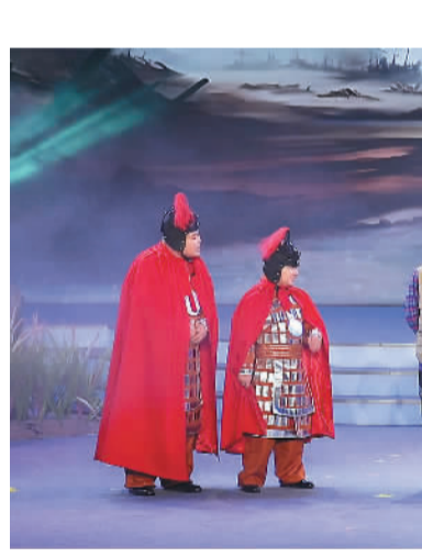
2024辽宁乡村喜剧晚会演出现场。

同时，为了扩大影响，铁岭还巧用网络和新媒体，创造新的传播方式，扩大影响力。当地联合美团大众点评策划的“铁岭文旅十连催李雪琴回家”话题，登上微博热搜，总计曝光量达3.3亿。网易辽宁策划了《锁定元宵节，看适合咱东北人体质的“喜晚”》栏目，每天推送视频，同步在今日头条、人民网、央视网等媒体推送，开展大规模网络宣发。《我要上喜晚》等多个宣传短视频，每天浏览量从5000+到6万+持续攀升。