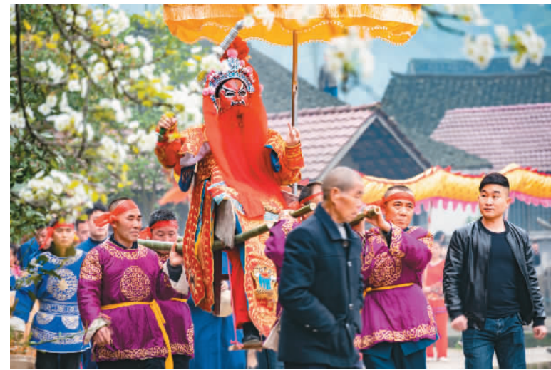
国家级非遗项目“辰河目连戏”走进田间地头。