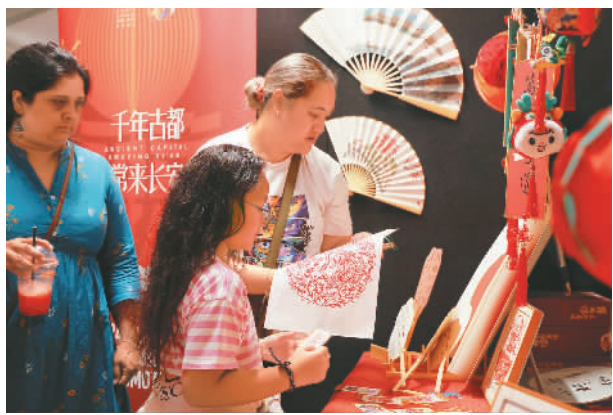
版年画。 新西兰奥克兰市民体验印制中国木

日前,地处澳大利亚悉尼情人港的澳大利亚国家海事博物馆平台大厅和码头露天剧场张灯结彩,喜庆热闹,西安市文化和旅游局“盛唐国潮畅游会”在此举行。畅游会采用室外舞台表演室内国潮畅游体验的形式,当地民众手持印有祥龙纹样的打卡卡片,尽情参与中国传统乐器、戏曲、舞蹈、书法、绘画、香道等文化体验活动。