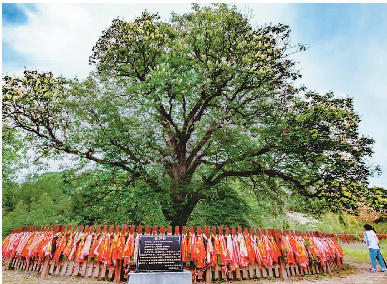
陕西省铜川市宜君县太安镇艾蒿洼村,相传为玄奘从天竺带回的娑罗子长成的大树。