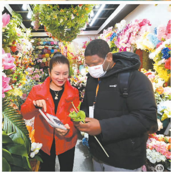
图③：义乌国际商贸城内，来自喀麦隆的外商和店主洽谈并选购小商品。