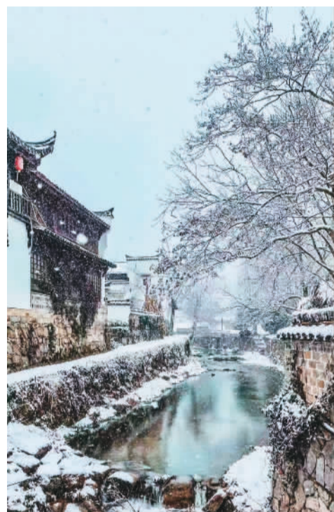
雪中查济村。