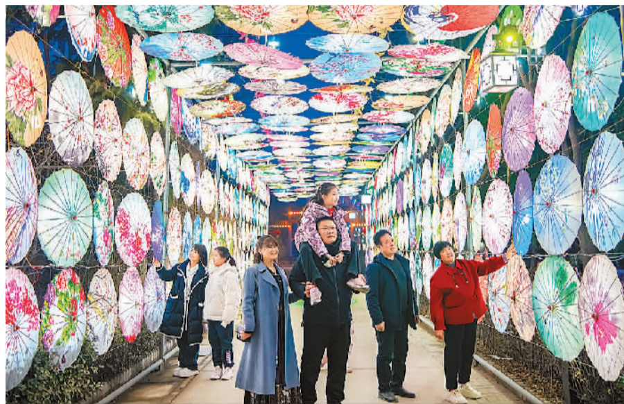
游客在运城市万荣县裴庄镇裴家大院游玩。

看古城、逛大院，是山西旅游的一大特色。到山西过大年，平遥值得一去。跟很多古城里只能看到天南地北的