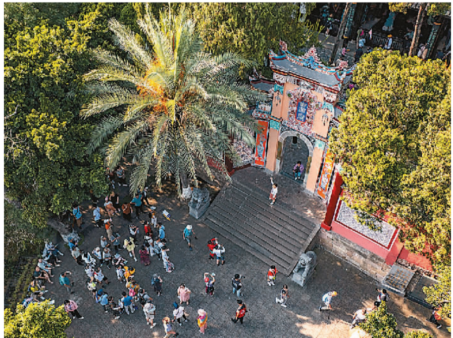
游客在重庆市奉节县白帝城景区游玩。