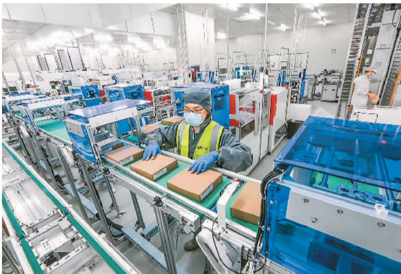
近日，安徽马鞍山经开区重点新能源项目正奇光能科技有限公司多条自动化生产线满负荷运转。马鞍山经开区全力做好服务保障，力争新春开门红，确保一季度经济强劲开局。图为工人正赶制光伏产品，确保订单如期交付。