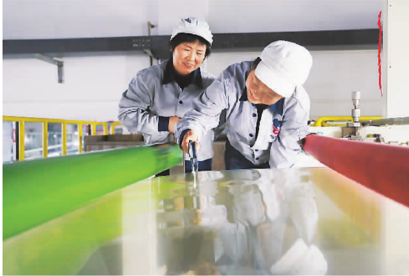
湖南省永州市新田县积极优化营商环境，通过开展“春风行动”、推动惠企政策落地等措施，帮助企业开工复产。图为该县一企业车间，工人在赶制新材料产品订单。

再如，吉林省2023年货物贸易进出口总值1679.1亿元，创历史新高。其中，“红旗”牌汽车等国货出口表现十分亮眼。长春海关副关长张