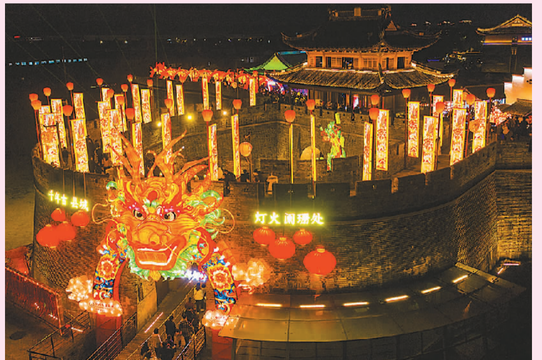
元宵节临近，浙江省宁波市江北区慈城古县城举办“2024年中国慈城龙年灯会”，吸引人们游古城、品美食、赏花灯。灯会以“九州神兽、古城闹春”为主题，结合《山海经》文化元素，展示了100多位四川自贡专业花灯手艺人打造的龙年花灯。据了解，该灯会将持续至3月22日，开放时间为每日14时至21时。

“春节假期，中国居民消费潜力加速释放，消费对经济的支撑作用持续凸显。”国家税务总局有关负责人介绍，今年春节假期，各地税务部门推出春节办税缴费“不打烊”服务，依托办税服务厅值守、自助办税、网上办税等多种方式，持续推进“非接触式”办税缴费，全力保障纳税人缴费人多样化需求。“税务部门将持续开展‘便民办税春风行动’，充分发挥税收大数据作用，提高‘好办事’的便利和‘办成事’的效率，进一步打造市场化、法治化、国际化税收营商环境。”该负责人说。