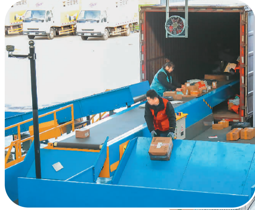
▲快递包装的轻量化、标准化能有效提高分拣效率。图为日前，位于山东省东营市的菜鸟网络广饶县快递集中配送中心，工作人员在分拣区进行卸车、扫描等工作。