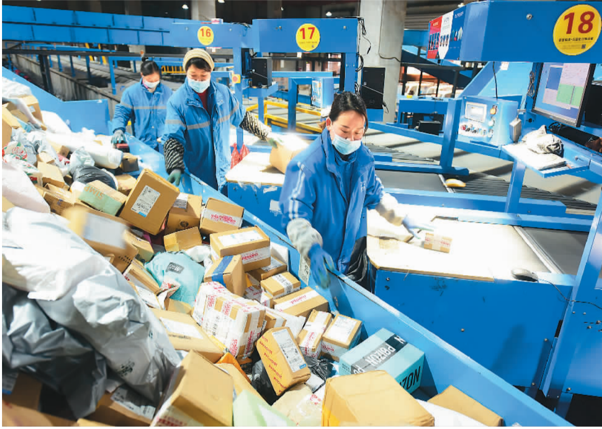
江苏省连云港市东海县电商物流产业园各快递企业为确保春节期间快递服务“不休网、不拒收、不积压”，采取优化智能化分拣设备、增加分拣频次、调整加配派送人员等措施，保障节日期间物流畅通运转。图为2月16日，该产业园的快递工作人员在流水线上分拣快递包裹。

“一方面，关注胶带、快递运单等包装材料的减量，比如实施《快递电子运单》国家标准，推动电子运单替代纸质运单，将原来的三联运单变为一联的‘小面单’；实施《邮政业封装用胶带》系列行业标准，推广使用45毫米及以下的‘瘦身胶带’等。”徐长兴说，“另一方面，关注电子商务、制造业、农业等上下游产业链协同，给出科学的包装操作指引。比如，目前正在研制的《限制快递过度包装要求》强制性国家标准，将对快递包装层数、空隙率、胶带使用等提出要求，避免重复包装、过度包装。”