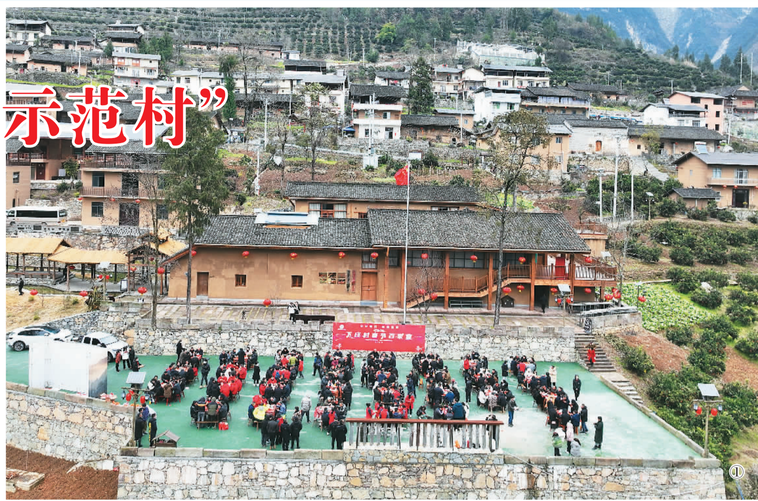
图①：2月5日（腊月廿六），下庄村民聚在一起看村晚、吃百家宴，共迎龙年春节。

今年是下庄村通路20周年。近年来，下庄村借助脱贫攻坚、乡村振兴等政策利好，发展起了旅游业、柑橘产业、非遗文化产业等。2023年，该村柑橘收入超过100万元，村民人均收入1.8万元左右，村集体收益16.22万元，11户村民通过民宿获得分红17.9万元。如今，下庄村从过去的“天坑村”，变成全国乡村治理示范村、全国乡村旅游重点村，曾经闭塞的村庄正走在致富增收的大路上。