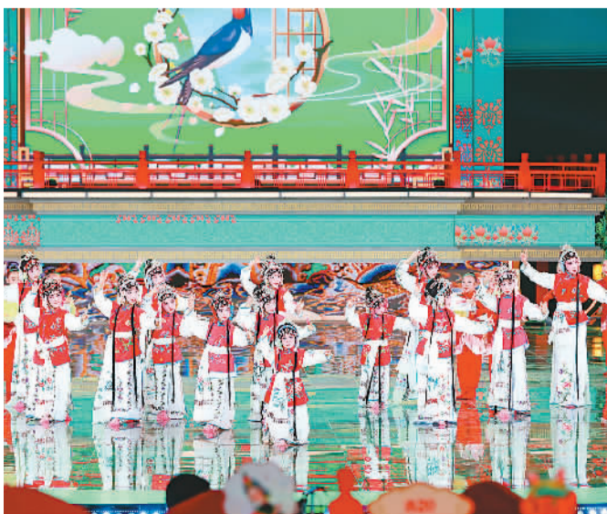
▲2024年春节戏曲晚会现场。

戏曲是中国文化走向世界的一张名片，承载着中国人特有的思维方式与情感叙事。展现戏曲剧种的和而不同、传统文化的丰富多样、中华文明的瑰丽多彩，对于讲好中国故事、传播好中国声音有着重要意义。春节戏曲晚会开办34年来，坚持从戏曲艺术中提炼中华文明的精神标识和文化精髓，成为中国文化“出海”的重要窗口、“戏曲+”破圈的当代范本。2024年春节戏曲晚会为观众呈现了一场兼具传统与时尚的戏曲盛宴，让世界看到了中国戏曲文化的新气象。