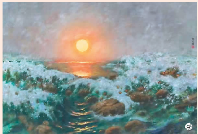
图④：颜文樑《祖国颂》 中华艺术宫(上海美术馆)藏