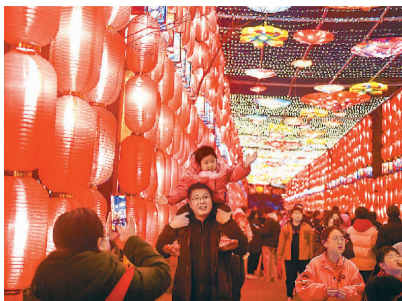
游客在河南省洛阳市2024隋唐洛文化庙会上欣赏新春灯展。