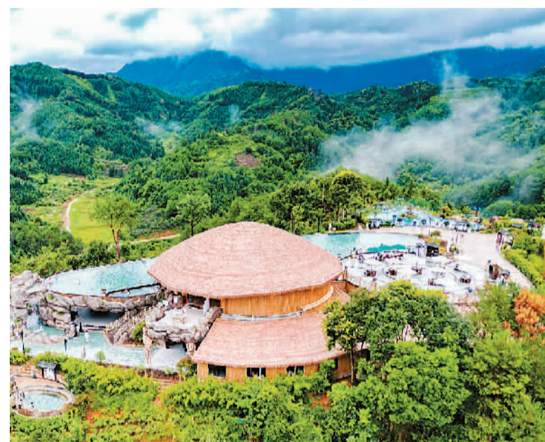
贺州南乡西溪森林温泉度假部与山景风光融为一体。