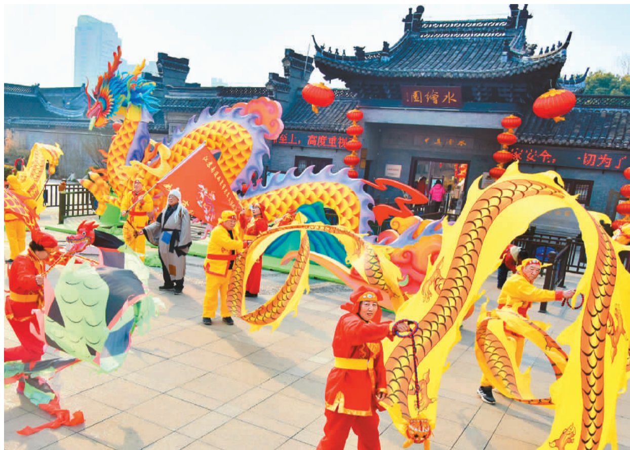
在江苏省如皋市水绘园风景区，彩带龙爱好者为游客表演舞龙。