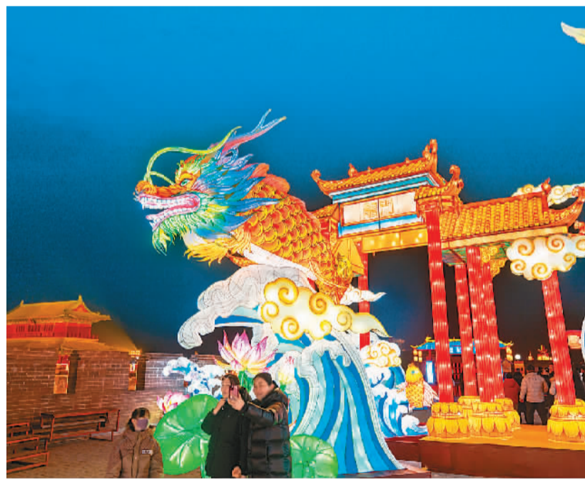
游客在河北省正定古城南城墙欣赏新春花灯。

特色民俗体验、非遗文化表演、庙会灯会、新年祈福等传统年俗活动，近年来不断与时尚元素融合创