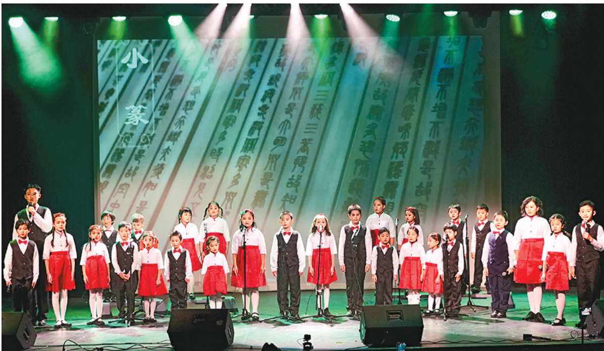
在2024“欢乐西岛”多元文化春节晚会上，孩子们朗诵《中国字，中国话》。

许多观众表示，“欢乐西岛”多元文化春节晚会不仅展现了中华优秀传统文化的魅力，还将丰富多样的文化元素融合在一起，呈现了一场文化盛宴。