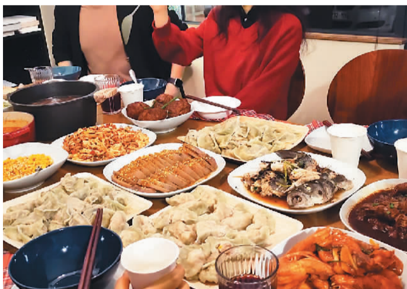
在法中国留学生们自己动手做出的年夜饭。

身在法国，远离家乡，一顿年夜饭永远牵动着学子的心，乡愁也总能在年夜饭的餐桌上得以慰藉。