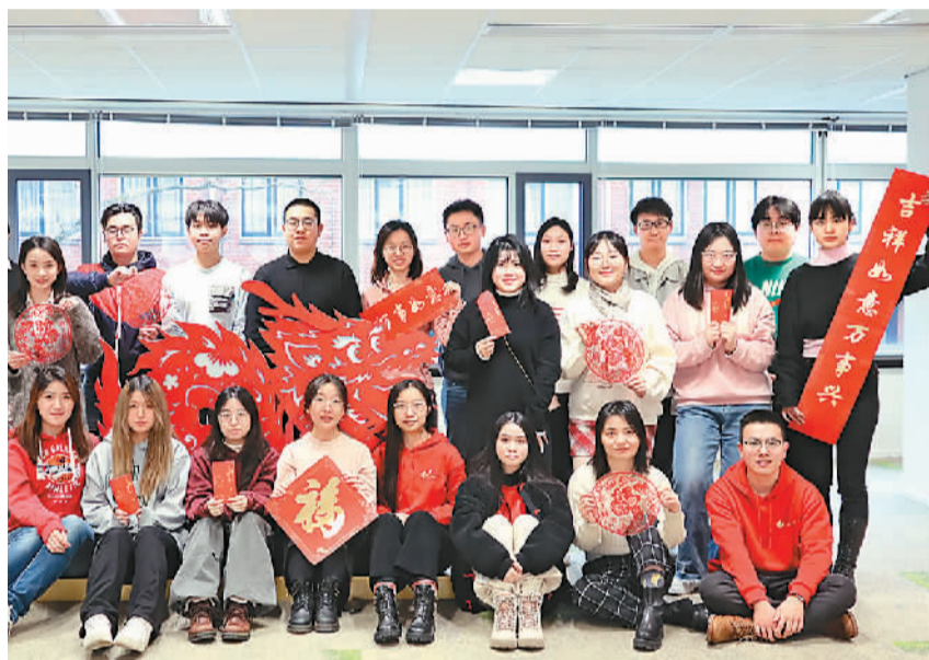
全荷学联成员一起迎接新年合影。