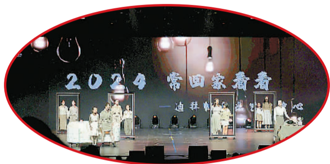
二声部演唱歌曲《是妈妈是女儿》。

日前,“星辰大海”2024第十届阿联酋华侨华人春节联欢晚会(以下简称“春晚”)在阿联酋迪拜歌剧院上演。此次春晚共有来自75个国家的1200余名演职人员参演。当天,2000多名华侨华人与各国友好人士欢聚一堂,共迎新春佳节。几位参与此次春晚的华侨华人表示,春晚不仅慰藉了旅阿华侨华人的乡愁,也架起中阿民心相通的桥梁。