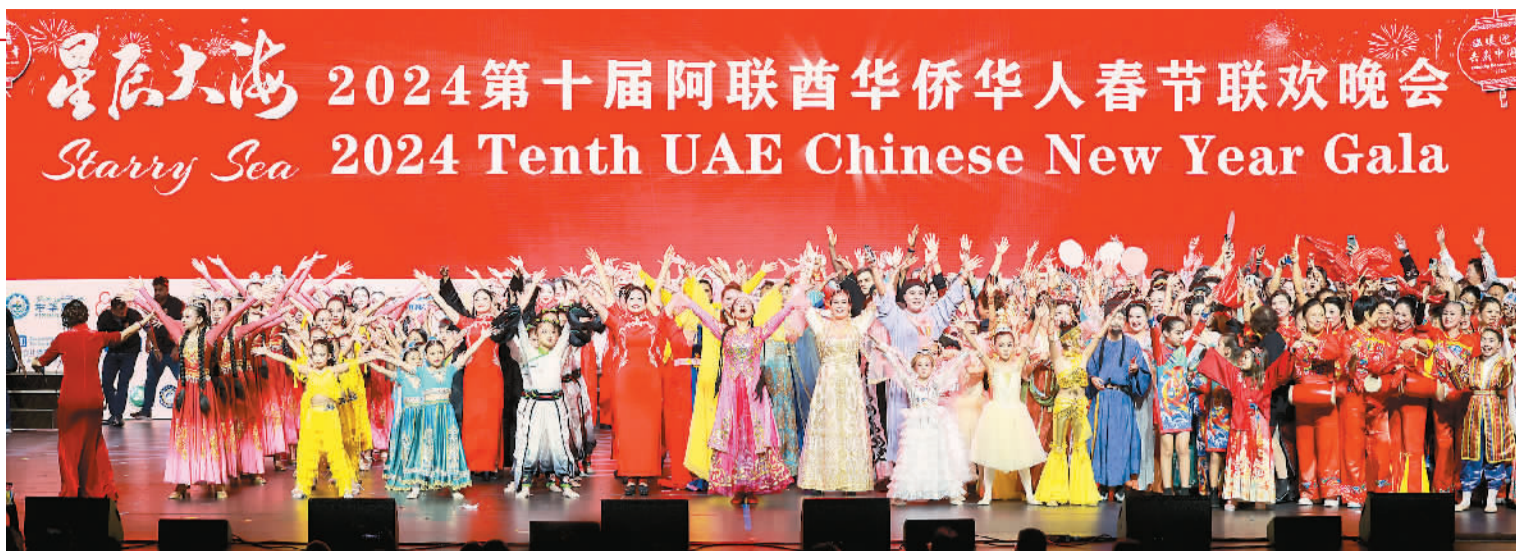
来自不同国家的演员身着民族服饰,一起表演舞蹈《各美其美/相亲相爱》。