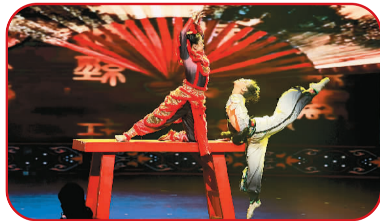
民俗传承载舞蹈《南狮梦》。