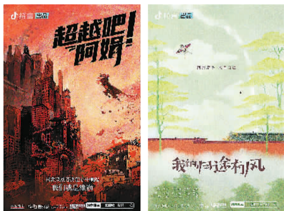
春节档精品微短剧《超越吧！阿娟》《我的归途有风》海报。

近日，抖音举行精品微短剧“辰星计划”发布会，面向影视公司、媒体机构、MCN机构以及个人创作者，给予精品微短剧资金和流量扶持。抖音2024春节档精品微短剧片单也一同发布，10部作品将在春节期间上线。