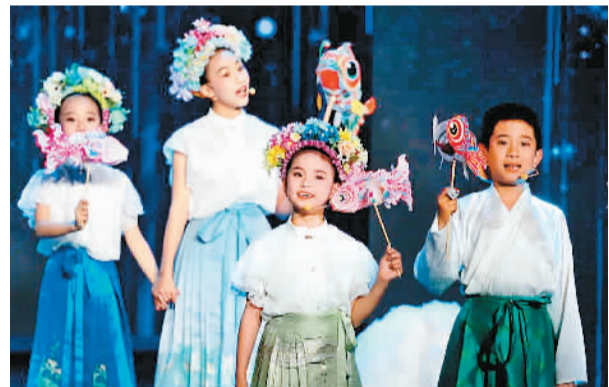
颁奖典礼上的闽南语童声合唱《鱼歌》。

中国民间文艺山花奖是由中国文联和中国民协联合主办的国家级文艺大奖，是全国民间文艺最高奖，自1999年以来已经举办16届，为传承弘扬中华优秀传统文化、促进民间文艺繁荣发展作出积极贡献。