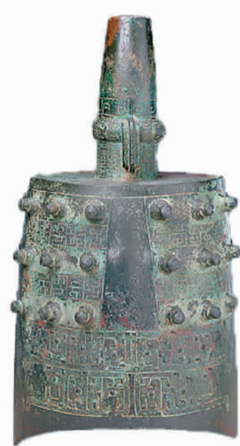
展出的春秋者减钟。

鼓浪屿上中西音乐文化共生、传统与现代文明交融，有着“音乐之岛”的美誉。主办方希望通过此次展览吸引更多走进鼓浪屿，感受音乐的魅力，欣赏多元文化交流互鉴的灿烂图景。