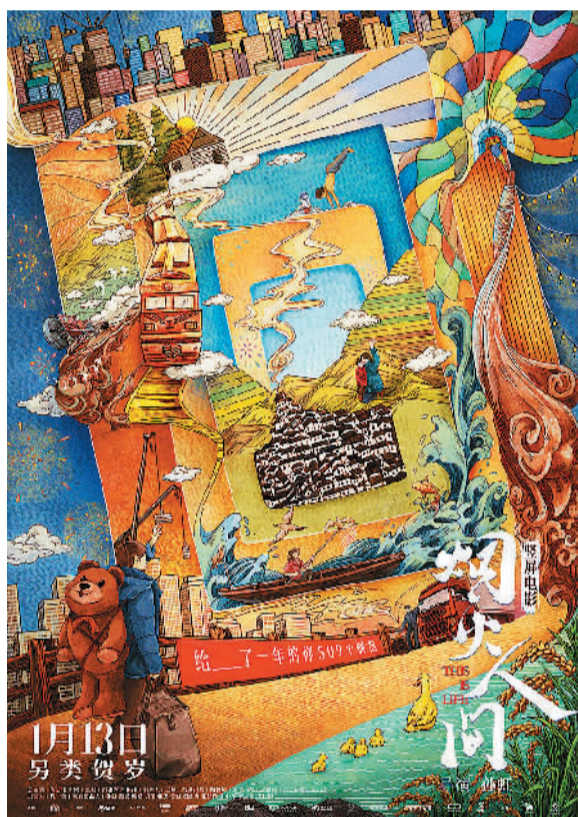
电影《烟火人间》海报。

今为止，我们看到的典型做法，是演员在导演的指导下按照一定的剧本表演，然后剪辑成一部电影。