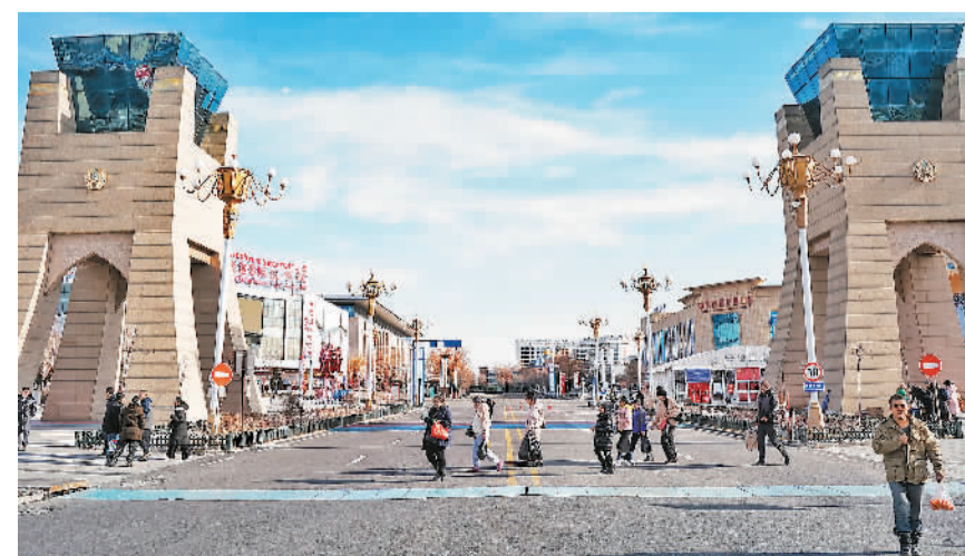
位于新疆自贸试验区霍尔果斯片区的中哈霍尔果斯国际边境合作中心日前迎来客流高峰。1月1日至15日,经霍尔果斯国际边境合作中心出入境人员逾19万人次。图为游客行走在中哈霍尔果斯国际边境合作中心内。

本报上海1月16日电(记者巨云鹏)记者从16日举行的长三角生态绿色一体化发展示范区新闻发布会上获悉,长三角一体化示范区执委会、沪苏浙两省一市发展改革委、苏州嘉兴两市政府近日共同印发《长三角生态绿色一体化发展示范区重大建设项目三年行动计划(2024—2026年)》,为示范区未来三年重大建设项目明确了路线图、任务书和时间表。 据介绍,该《行动计划》重在推动更多功能性项目早出形象、快出功能;重点聚焦先行启动区,重点关注跨区域、跨流域、战略性新兴产业集群等项目;同时围绕示范区建设发展新阶段新要求,更加强调项目成熟度,更加突出高能级、牵引性项目的落地,加快提升示范区集聚度和显示度。