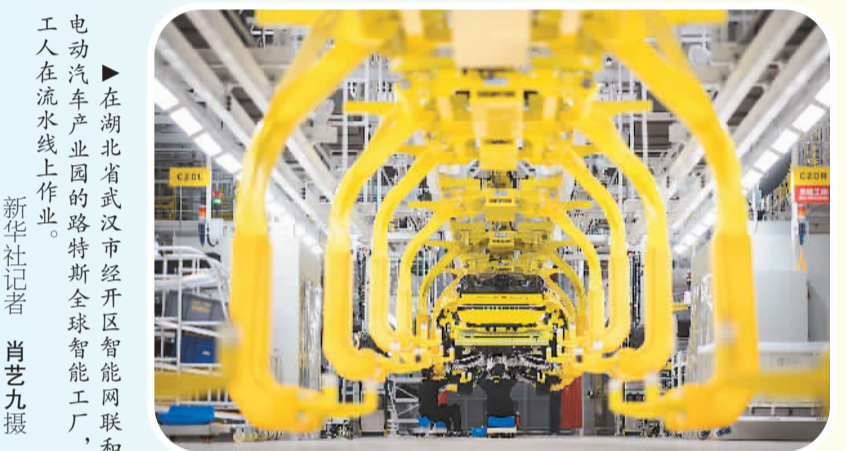
在湖北省武汉市经开区智能网联和电动汽车产业园的路特斯全球智能工厂，工人在流水线上作业。

险。报道称，中国国家统计局数据显示，2023年前三季度，内需对中国经济增长的贡献率达113%，其中最终消费支出对经济增长的贡献率达83.2%。