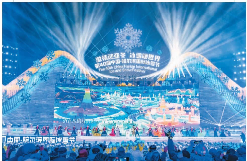
日前，第40届中国·哈尔滨国际冰雪节开幕，吸引了众多游客。图为在黑龙江省哈尔滨市冰雪大世界园区拍摄的开幕式现场。

未来，中国冰雪休闲发展前景广阔。一方面，可以持续增加冰雪休闲产品，加大冰雪休闲的营销推广力度，重视制造热点、主动传播、有效引流等问题，进一步增强社交媒体的传播效能，让更多的冰雪休闲供给和冰雪休闲需求能够实现“双向奔赴”、动态适配；另一方面，要从以往以冰雪休闲为导向向“冰雪休闲+”，围绕冰雪休闲消费进行破圈发展、衍生发展，构建满足滑雪爱好者消费需求的生态圈，做好需求链、服务链、供应链的链条延伸，以更丰富的项目创新、产品组合和体验优化来推动冰雪休闲的可持续、高质量发展。(本报记者 徐令缘采访整理)