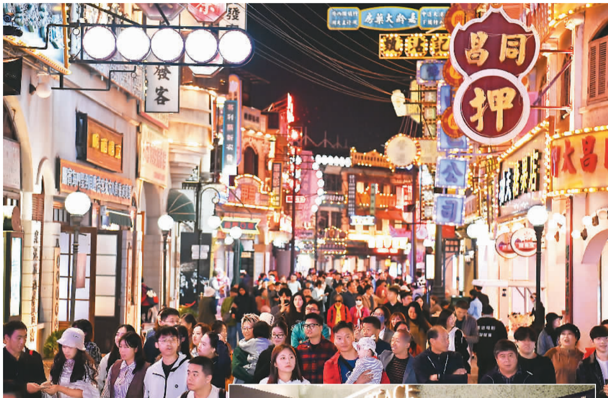
▲2023年11月9日晚，浙江省东阳市横店影视城广州街·香港街景区灯火通明，各地游客纷至沓来。 ▲2023年7月15日，上海，高温天气未阻碍影迷赴电影院观影。

2023年5月21日，财政部、国家电影局发布《关于阶段性免征国家电影事业发展专项资金政策的公告》，为支持电影行业发展，自2023