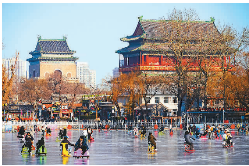
市民和游客在北京什刹海冰场滑冰。