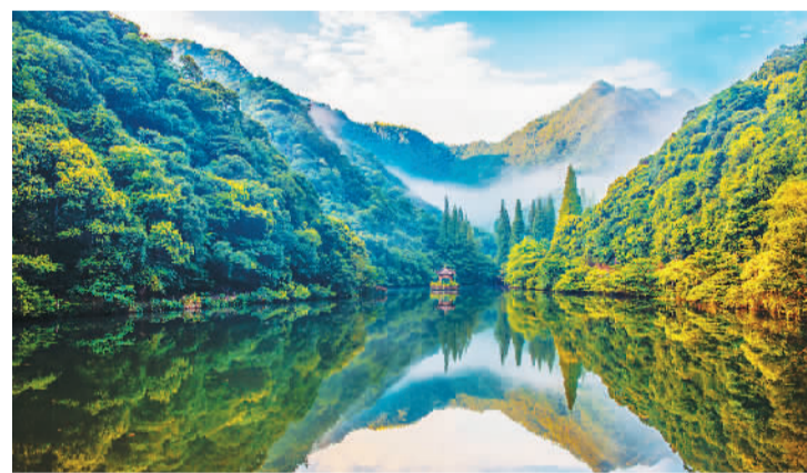
风景秀丽的宁海森林温泉景区。

寒潮来袭，位于浙江省宁波市宁海县深刨镇的宁海森林温泉景区却是一派“火热”景象，掩映于山林间的十余个露天温泉池冒着热气，男女老少沉浸于温暖的泉水中，尽享天然温泉和自然美景带来的闲适。