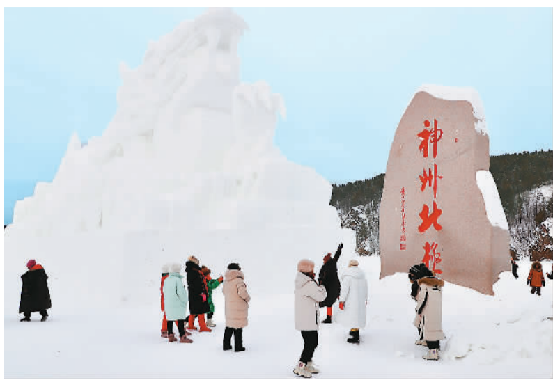
游客在黑龙江省漠河市北极村拍照。