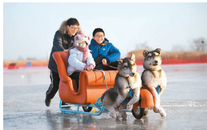
游客在宁夏银川市鸣翠湖滑雪场乐享冰雪游。

六盘山深处的宁夏固原市泾源县是座人口不足9万的小城，却拥有两座滑雪场，一到冬季不少“宁”“陕”