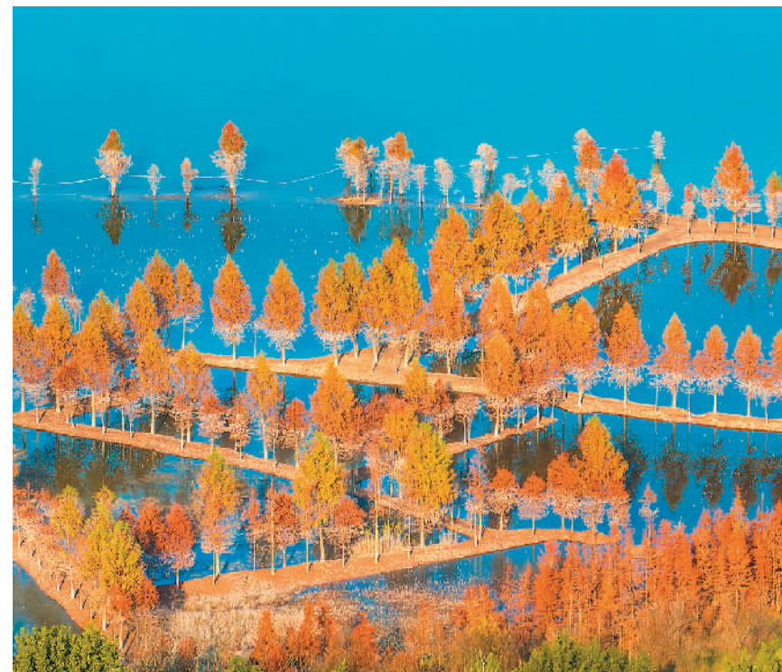
日前,重庆市开州区滨湖公园层林尽染,碧水与彩林相映,构成一幅独特的冬日图景。

中国第40次南极考察由中国自然资源部组织,计划依托“雪龙”号、“雪龙2”号和各考察站开展一系列综合调查监测,深入研究南极在全球气候变化中的作用。