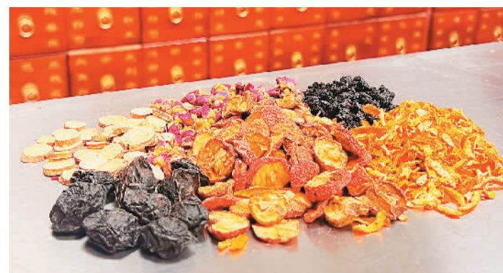
北京中医医院药学部药师根据酸梅汤配方抓取的中药茶饮。

其实，酸梅汤是中国传统的消暑饮料。中药版酸梅汤的“翻红”，反映出年轻人对中医药的认可、信赖和对健康生活的向往。中医药学包含着中华民族几千年的健康养生理念及其实践经验，是中华文明的瑰宝，凝