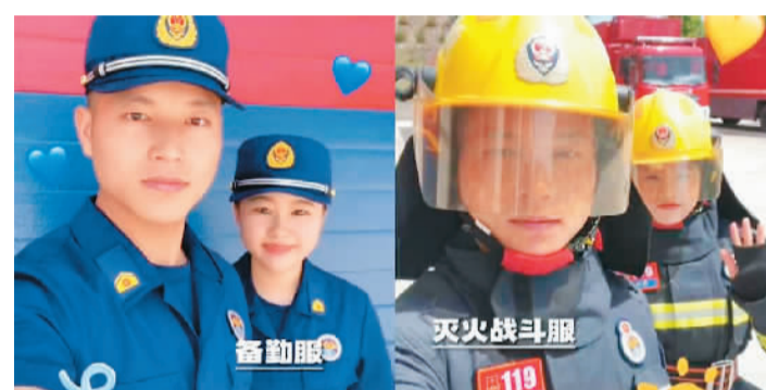
江西消防发布的“多巴胺穿搭”。

“多巴胺”是一种化学物质，它既是一种激素，也是一种神经递质，能传递兴奋和愉悦的信息。多巴胺主要在脑细胞和肾上腺细胞中合成，可以影响人的运动、认知、情绪、睡眠等多个方面，其水平和平衡对人的健康和幸福至关重要。今夏，“多巴胺穿搭”用高饱和度的色彩、鲜艳明亮的搭配，营造轻松愉快的视觉氛围，让人产生愉悦的体验。“多巴胺穿搭”走红后，“多巴胺XX”