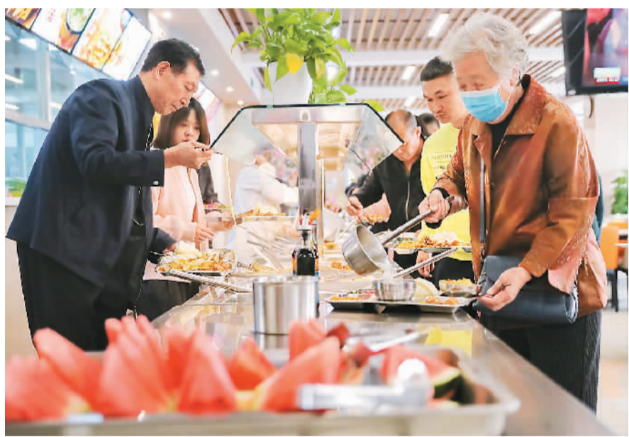
10月13日，吉林省长春新区飞跃街道三佳社区敬老餐厅内，老人正在选取午餐。

今年起，国家卫健委等相关部门部署开展全国医疗卫生机构信息互通共享三年攻坚行动。当前，国家全民健康信息平台已基本建成，省统筹区域全民健康信息平台不断完善，基本实现国家、省、市、县平台联通全覆盖。目前，已有8000多家二级以上公立医院接入区域全民健康信息平台，20个省份超80%的三级医院已接入省级全民健康信息平台，25个省份开展电子健康档案省内共享调阅，17个省份开展电子病历省内共享调阅。依托平台，各地通过办好“一件事联办”等关键小事，取得了信息惠民惠民的良好效果。