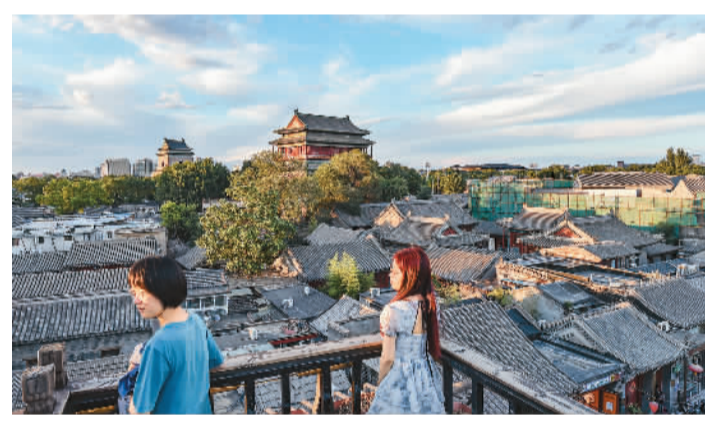
6月10日，人们在北京什刹海附近咖啡厅露台欣赏风景。

“私藏小众胡同骑行路线”“夏日晚风氛围感路线”“日行2万步路线”……社交平台上，网友们晒出的City walk方式和路线五花八门，年轻人试图用自己的方式，找寻专属的风景，解锁一座城市的不同面，在探索城市