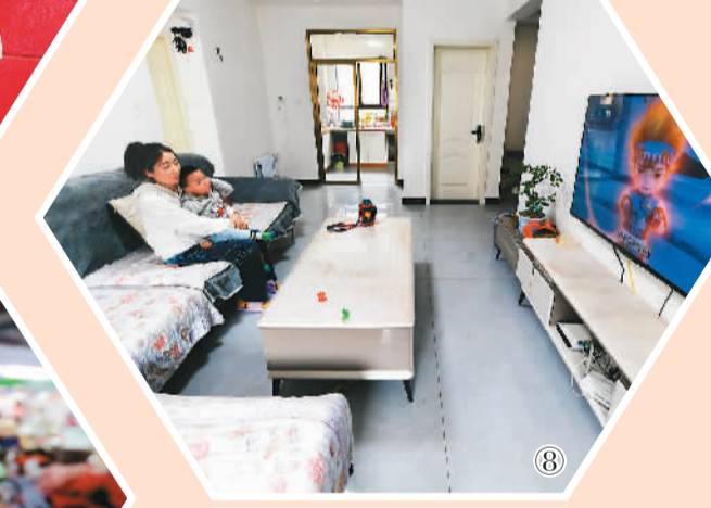
图⑧：甘肃省陇南市宕昌县沙湾镇，居民在看电视。