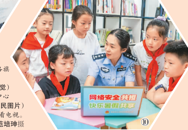
图⑩：民警在江苏省海安市海安街道海陵社区给学生讲解安全上网知识。