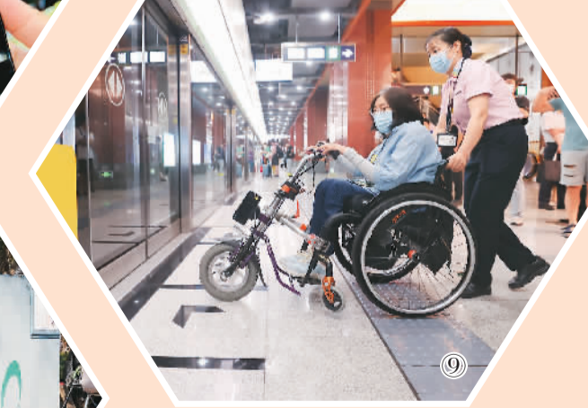
图⑨：北京，地铁工作人员帮助使用轮椅的乘客乘车。