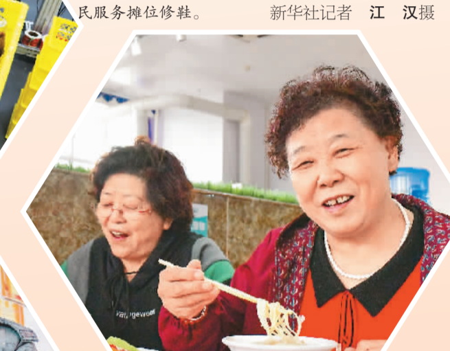
图⑥：老年人在内蒙古鄂尔多斯市伊金霍洛旗王府路社区为老餐厅享用早餐。