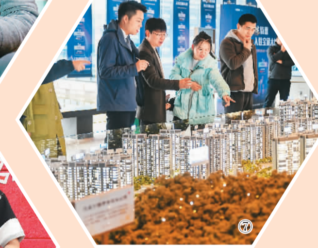
图⑦：湖南省长沙市，市民在一楼盘营销中心选房看房。