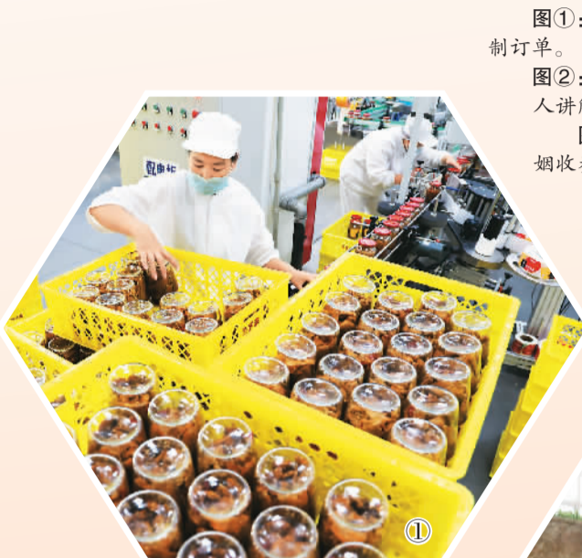
图①：在山东省乐陵市一家预制菜生产企业车间内，工人赶制订单。