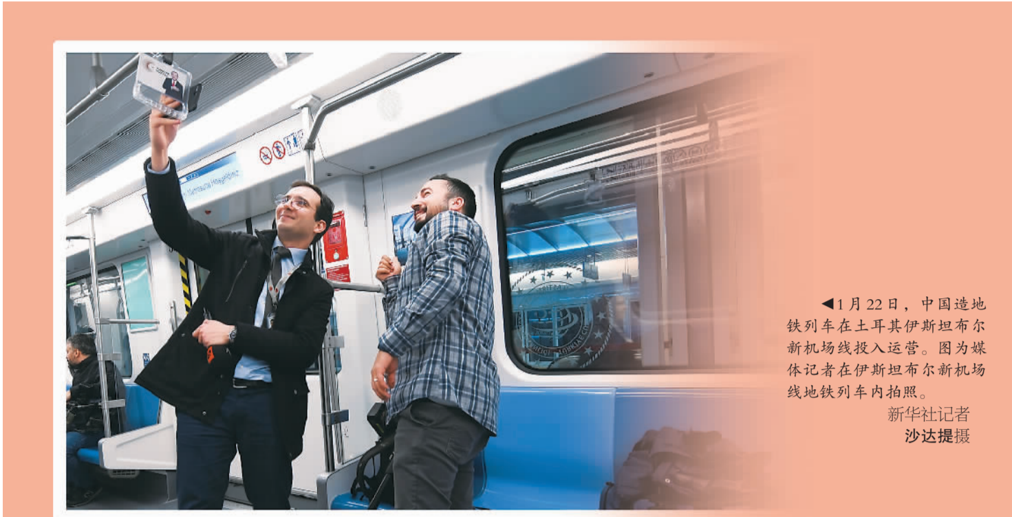
1月22日，中国造地铁列车在土耳其伊斯坦布尔新机场线投入运营。图为媒体记者在伊斯坦布尔新机场线地铁列车内拍照。

伟大出自平凡，平凡造就伟大。2023年，《中国故事》版将大量笔墨留给平凡岗位上的普通人，记录他们初心不改的执着、无怨无悔的坚守、脚踏实地的奋斗，展示他们