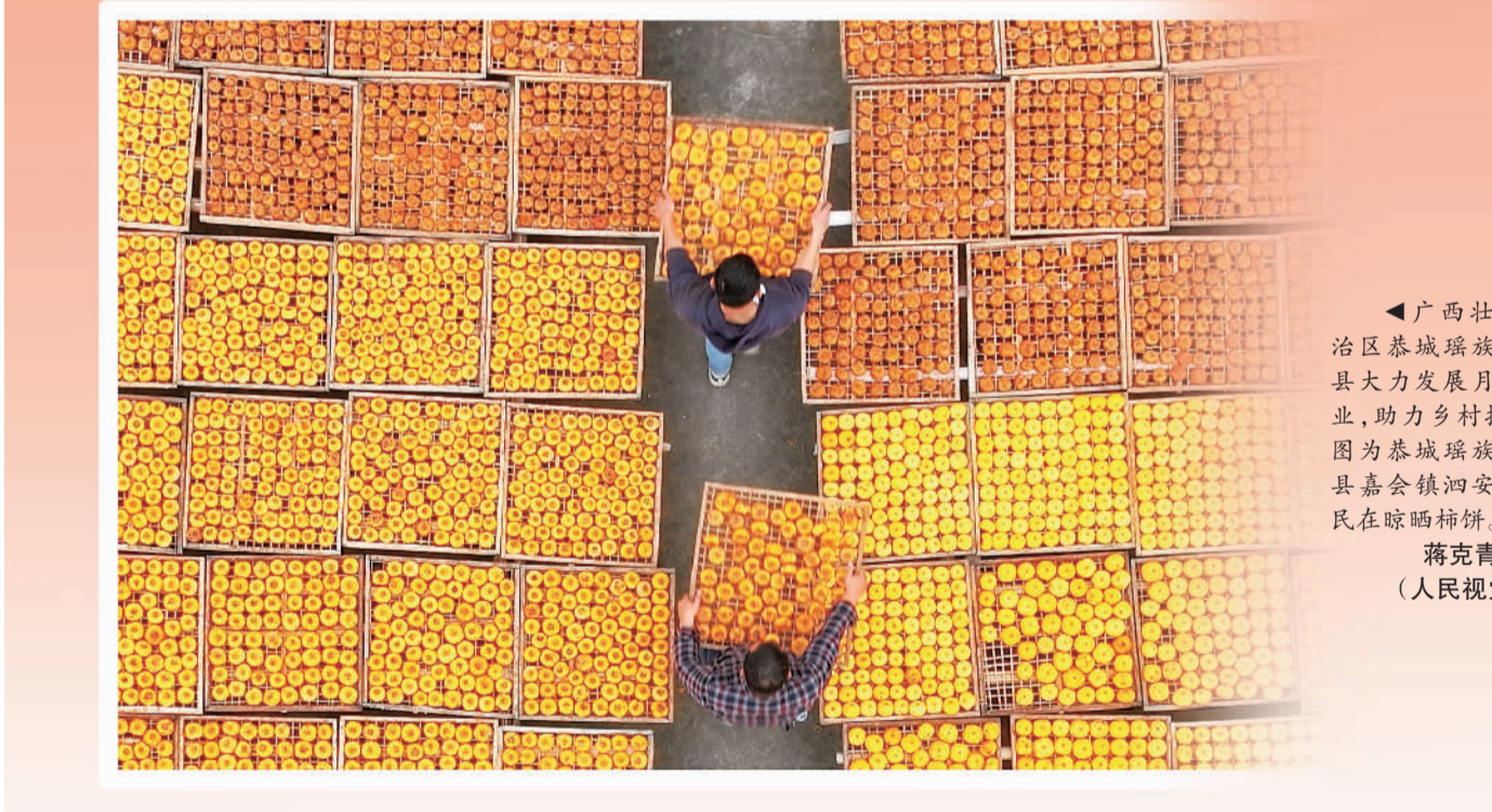
广西壮族自治区恭城瑶族自治县大力发展月柿产业，助力乡村振兴。图为恭城瑶族自治县嘉会镇泗安村村民在晾晒柿饼。