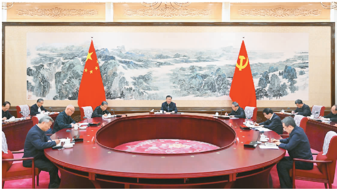
12月21日至22日,中共中央政治局召开学习贯彻习近平新时代中国特色社会主义思想主题教育专题民主生活会,中共中央总书记习近平主持会议并发表重要讲话。

新华社北京12月22日电 中共中央政治局于12月21日至22日召开学习贯彻习近平新时代中国特色社会主义思想主题教育专题民主生活会,聚焦学思想、强党性、重实践、建新功总要求,对照凝心铸魂筑牢根本、锤炼品格强化忠诚、实干担当促进发展、践行宗旨为民造福、廉洁奉公树立新风具体目标,按照以学铸魂、以学增智、以学正风、以学促干重要要求,联系中央政治局工作,联系带头旗帜鲜明讲政治、带头学懂弄通做实习近平新时代中国特色社会主义思想、带头贯彻党中央决策部署、带头践行宗旨为民造福、带头履行全面从严治党责任等方面的实际,总结成绩,查摆不足,进行党性分析,开展批评和自我批评。