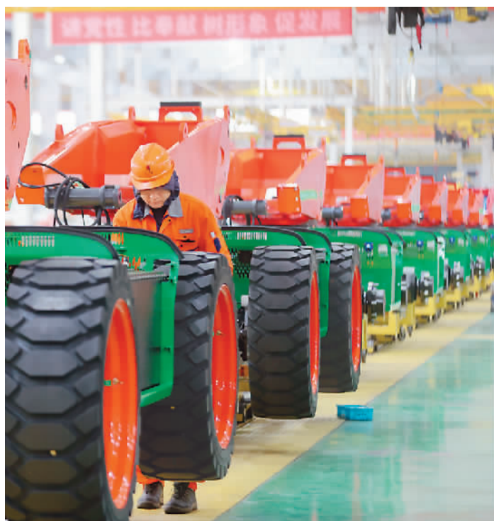
临近年末，各地企业开足马力赶制订单产品，全力冲刺“全年红”。图为浙江省湖州市德清县雷甸镇一家机械生产企业内，工人正在赶工。