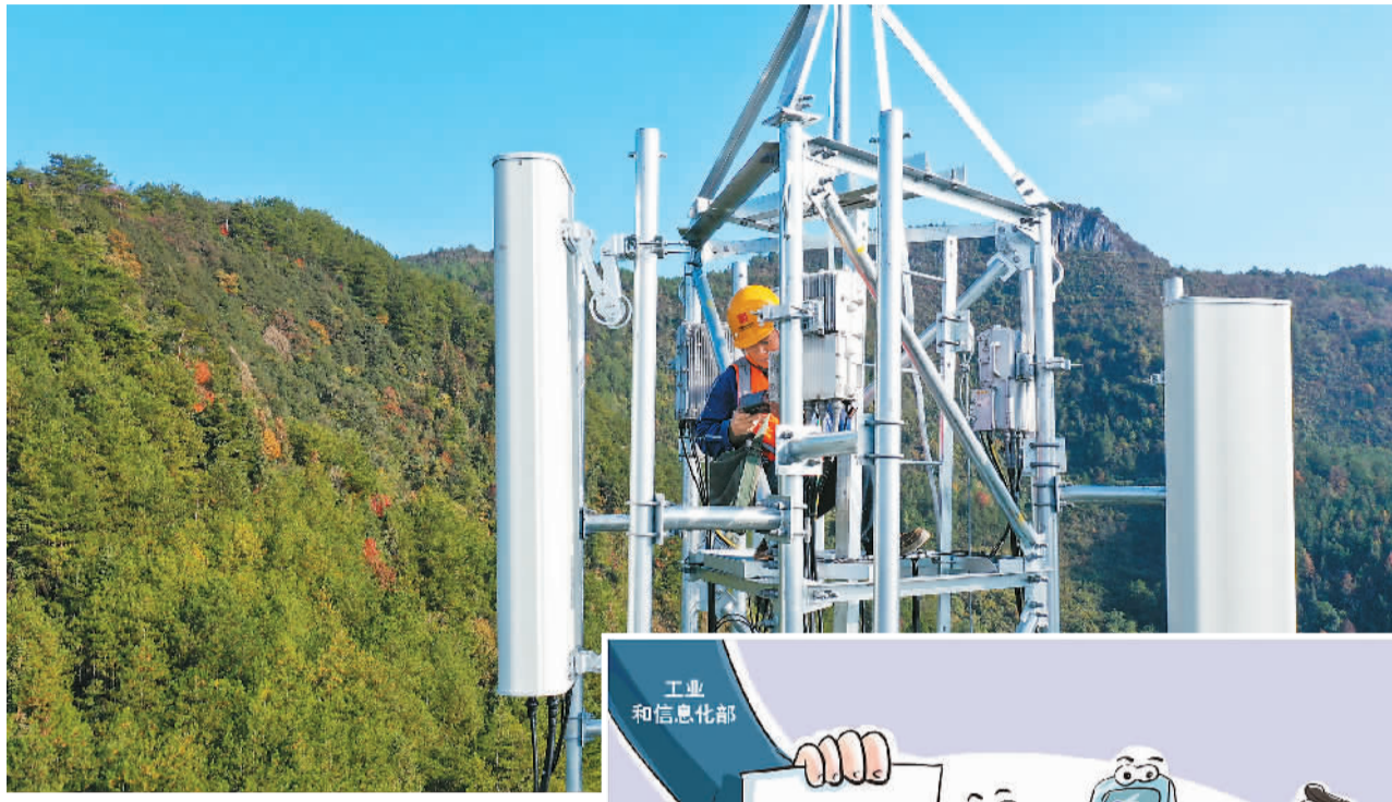
▲2G、3G逐渐淡出大众视野的同时，5G通信正稳步发展。图为重庆市酉阳土家族苗族自治县苍岭镇小店村5G基站建设工地，中国通信技术人员正在安装调试5G网络信号。

据不完全统计，全球已有100多个运营商实施了2G、3G退网，将2G、3G腾退的频率用于4G、5G的部署。早在2019年10月，工信部就提出，中国移动通信的网络面临2G、3G退网的条件已经逐渐成熟，鼓励运营企业积极引导用户迁移转网，将有限的频率资源和网络资源用到4G、5G移动