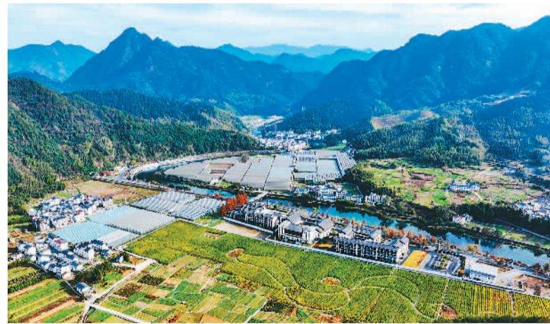
浙江下姜村入选2023年联合国世界旅游组织“最佳旅游乡村”名单,登上世界舞台。图为冬日的下姜村,绿水环绕、青山环抱,风景如画。