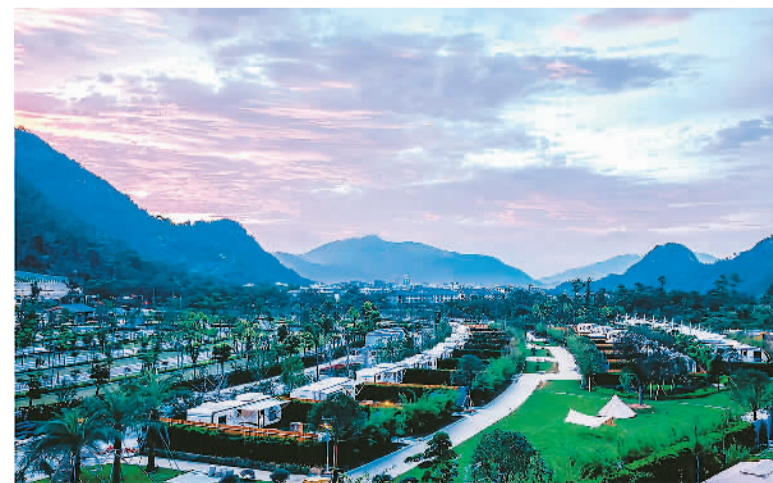
近年来,浙江省乐清市雁荡镇依托山海文旅资源打造乡村共富新图景。雁荡镇坚持党建引领,围绕“景区、镇区、海岛”三条主线,总体布局,统筹规划,通过多元开发促共赢,让土地资源活起来;通过整体提升助增值,让乡村颜值靓起来;通过点石成金兴产业,让乡村居民富起来。