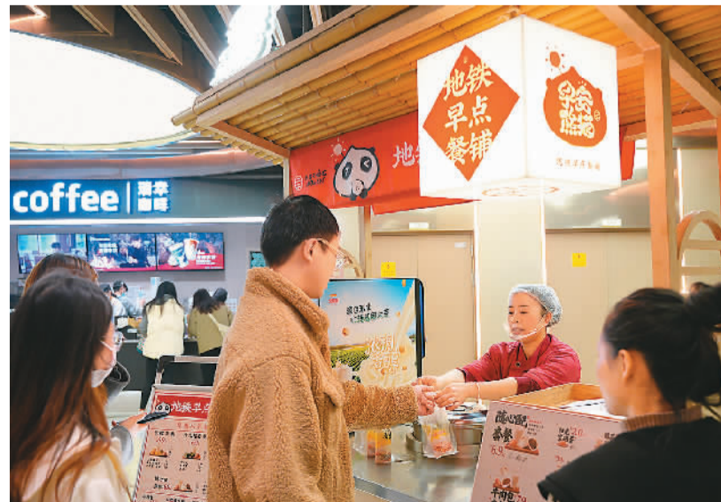
目前,成都轨道集团已在20个站点开设“早安熊猫”地铁早餐铺,提供4大类14个品种的早餐,丰富市民乘客的早餐选择。下一步,乘客还可以通过“小程序线上购买+过路取餐”的“网订点取”模式,进一步节约等待时间,提升通勤的便捷性和舒适度。图为四川省成都市市民在“早安熊猫”地铁早餐铺购买早餐。