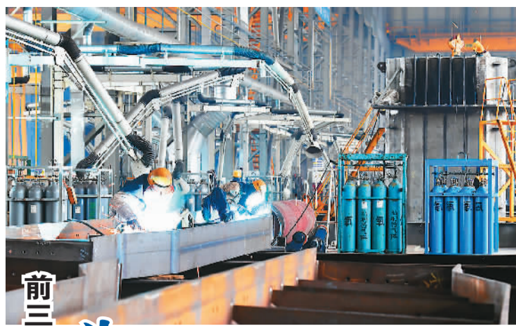
前三季度,国家高新区园区GDP占全国比重为百分之十三点五

据介绍,国家高新区聚集了近80%的全国重点实验室、70%的国家制造业创新中心、78%的国家技术创新中心。从研发投入看,国家高新区企业研发投入超万亿元,占全国企业研发投入近一半。从成果产出看,国家高新区企业拥有发明专利占全国接近一半;智能机器人、卫星导航等一批引领性原创成果在高新区加