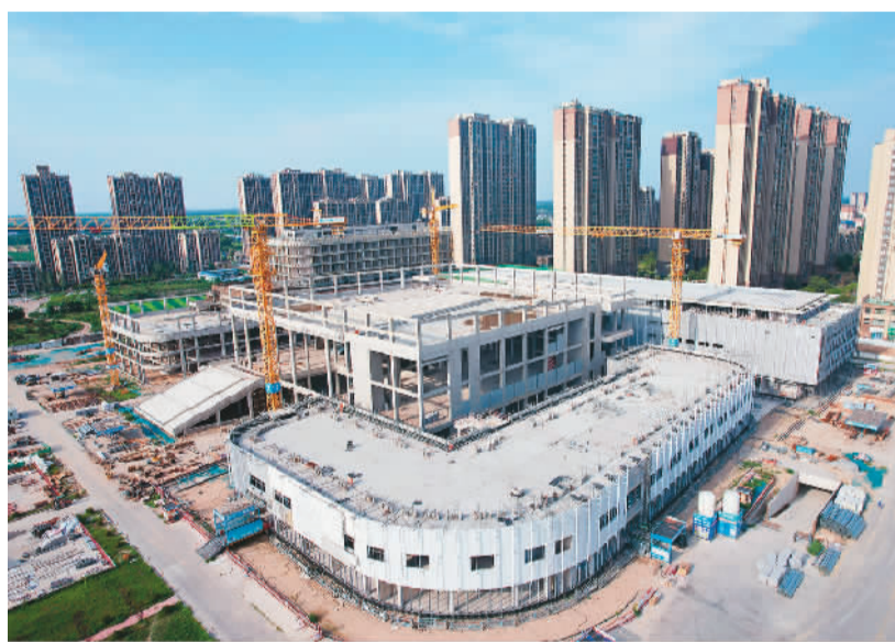
近日,由中建七局一公司参建的河南开封市民公共文化服务综合体项目主体全面封顶。该项目是河南省重点民生工程,建成后将成为集科教、文化、体育等功能于一体的市民公共文化服务中心,对满足开封市民基本公共文化需求、增强城市文化软实力具有重要意义。

其中,广东出口机电产品增长0.8%,占广东出口总值的65.5%。出口值较大的自动数据处理设备及其零部件、电工器材、家用电器分别增长0.6%、1.9%和6.9%;“新三样”电动载人汽车、锂电池、太阳能电池分别增长3.1倍、18.1%、27.5%;集成电路、船舶增长24.4%和47%。