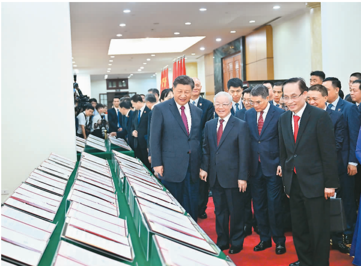
当地时间12月12日下午，刚刚抵达河内的中共中央总书记、国家主席习近平在越共中央驻地同越共中央总书记阮富仲举行会谈。这是会谈后，两党总书记共同见证双方签署的双边合作文件展示。