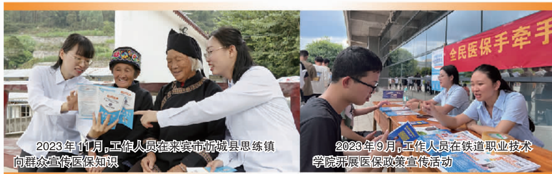
2023年11月,工作人员在来宾市忻城县思练镇向群众宣传医保知识