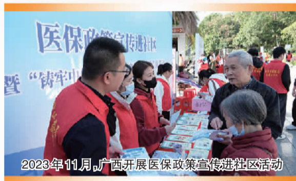
2023年11月,广西开展医保政策宣传进社区活动

广西壮族自治区医疗保障局自2018年挂牌成立以来,聚焦夯实民生基础,不断健全多层次医疗保障制度体系,深化医药卫生体制改革,优化医保公共管理服务,重实效、强落实、抓落地,奋力推进医疗保障事业高质量发展。