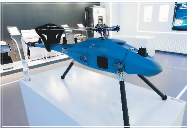
珠海高新区科技创新展示厅内，珠海紫燕无人飞行器有限公司展示的隼10无人直升机。

才的智慧力量，引领更多海内外留学人才弘扬留学报国传统，为加快粤港澳大湾区建设贡献海归人才力量。