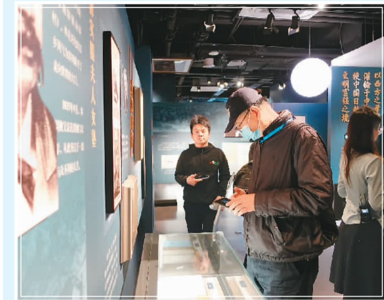
与会嘉宾在珠海留学文化馆内参观。

12月2日下午，“粤港澳大湾区科技创新发展”“国际金融枢纽建设”“建设高水平人才高地”“弘扬留学报国传统”等4个平行主题论坛同时举行。与会的行业知名专家、杰出留学归国人才、优秀企业家等围绕粤港澳大湾区高质量发展等主题研讨交流，旨在进一步凝聚起海内外留学人