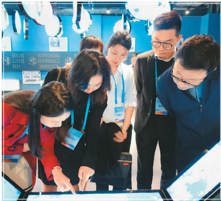
与会嘉宾观看珠海留学文化馆内的“留学地图”。