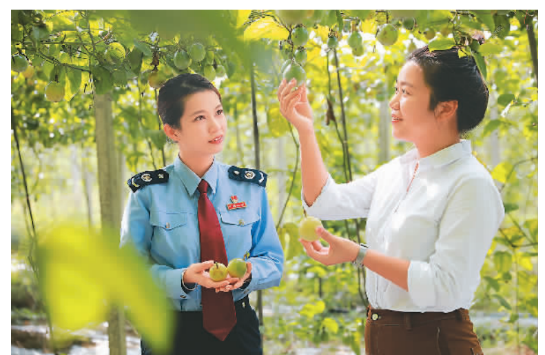
国家税务总局防城港市税务局聚焦广西特色产业高质量发展，出台特色产业税收政策和纳税服务指引，助力当地农业特色产业持续向好发展。图为近日，该局税务人员在广西壮族自治区防城港市防城区那朵花村百香果基地进行特色产业税收政策专项辅导工作，了解相关税收政策落地情况。

近年来，余杭从完善产业政策体系、打造文艺精品集群、加大资金支持力度、培育明星园区、助推文化出海等方面加快构建以国潮为代表的文化产业体系。今年前三季度，全区规上文化企业达168家，实现营收3749亿元、同比增长17.8%，总量占全市的55%，产业规模居全省第一。在数字文化产业方面，余杭以良渚新城等产业平台为重点，构建了梦栖小镇升级版、良渚数字文化社区等载体，目前已集聚800余家数字文化类企业。