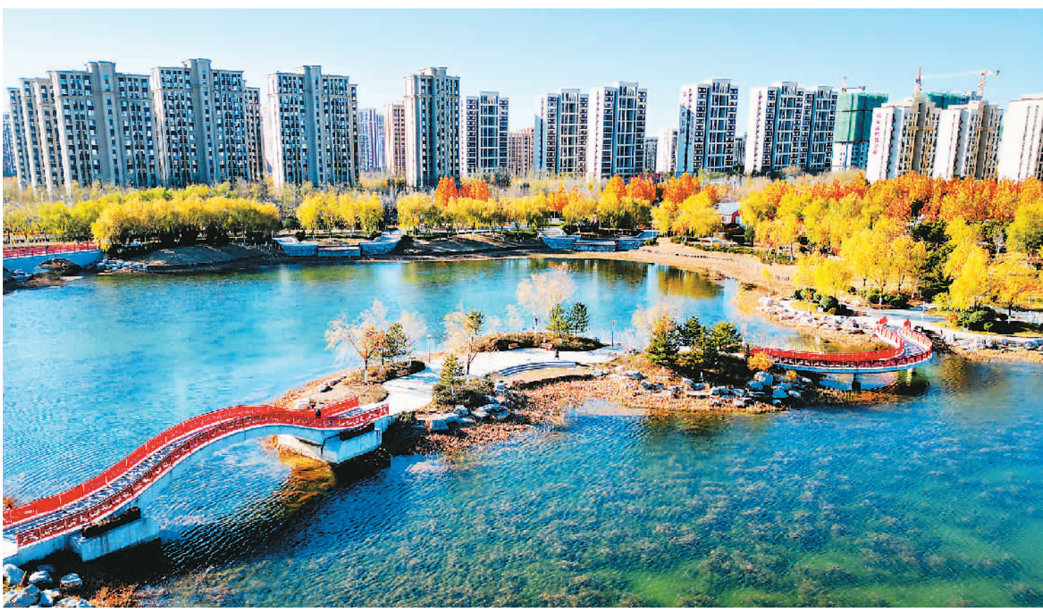
山东省东营市积极推进公园城市建设，因地制宜建设各类公园、游园及绿色通道，形成了一批各具特色、各具形态的生态氧吧，高质量发展生态底色更加靓丽。图为十一月三十日，东营市东营区黄河路街道歌井公园景色怡人。