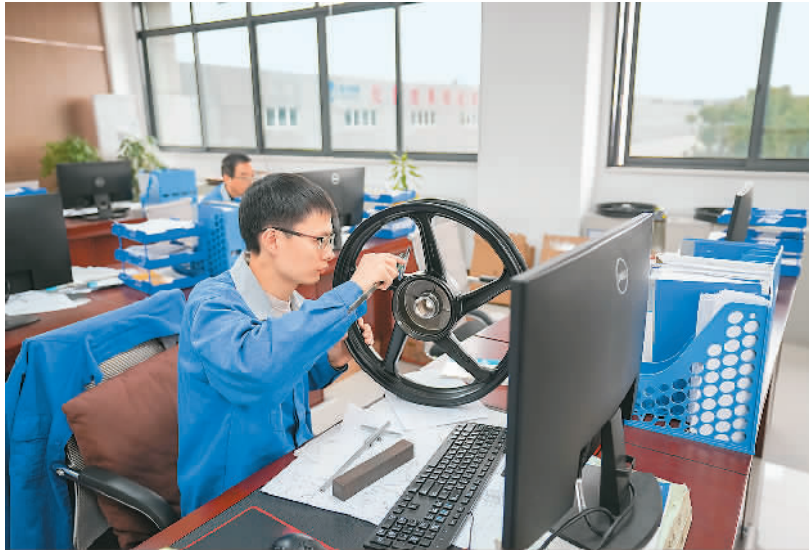
重庆市是全国重要的摩托车零部件产地之一，产品远销海外。图为11月28日，在重庆市垫江县重庆捷力轮毂制造有限公司的研发中心，科研人员研究摩托车轮毂产品的改进。

同时，企业信心继续向好。生产经营活动预期指数为55.8%，比上月上升0.2个百分点，继续位于较高景气区间，制造业企业对市场发展前景总体保持乐观。