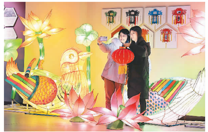
日前，河北省石家庄市藁城区屯头村迎来宫灯出口销售旺季，从事宫灯设计生产的村民忙着制作各种类型的出口宫灯。该村宫灯产品远销越南、韩国、日本等国，今年出口额已达6000万元。藁城宫灯历史悠久，2007年被列入河北省级非物质文化遗产名录。图为11月29日，游客在屯头村宫灯博物馆参观。