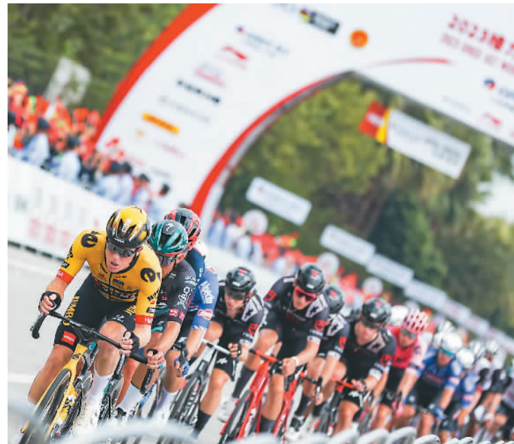
参赛选手在2023年环广西公路自行车世界巡回赛比赛中骑行。

环广西公路自行车世界巡回赛举行期间，常能在赛道两旁看到车迷陪伴选手骑行。据组委会介绍，今年赛事所经过的5个城市，每到开赛都会吸引几百甚至上千名骑行爱好者。赛事主持人布雷德·索纳尔认为，“比赛在满足群众观看高水平体育赛事需求的同时，也激发了更多人对自行车运动的热情。”今年的比赛让我印象深刻。不仅城市面貌不断改善，赛事规模越来越大，观赛人群也越来越多。”布雷德·索纳尔说。