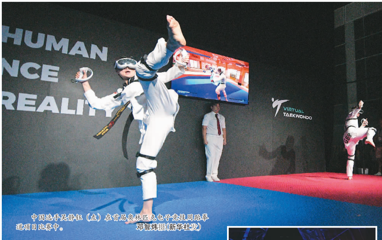
中国选手吴静钰(左)在首届奥林匹克电子竞技周跆拳道项目比赛中。

从杭州亚运会的“数实融合”点火，到校园里的智慧操场；从助力运动员训练的“黑科技”，到吸引目光的虚拟体育赛事……如今，越来越多的数字科技正在改变体育产业的发展形态，为开展全民健身、推进体教融合、建设健康中国和体育强国，创造了全新的路径和方法。