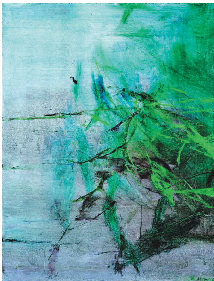
▲ 18.03.2008（油画） 赵无极作