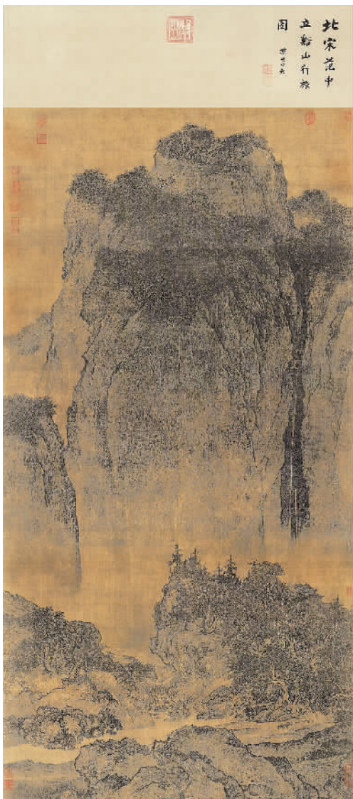
▲ 溪山行旅图轴（中国画） 范宽（北宋）作