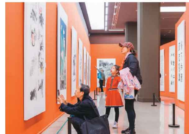
▲ 浦江书画作品晋京展现场

本次展览为2023浦江·第十六届中国书画节系列展览之一。与此同时，2023浦江·第十六届中国书画节开幕式暨“万年浦江”2023·全国中国画作品展、“翰墨清风”2023全国清廉政法书画作品展在浦江开展。