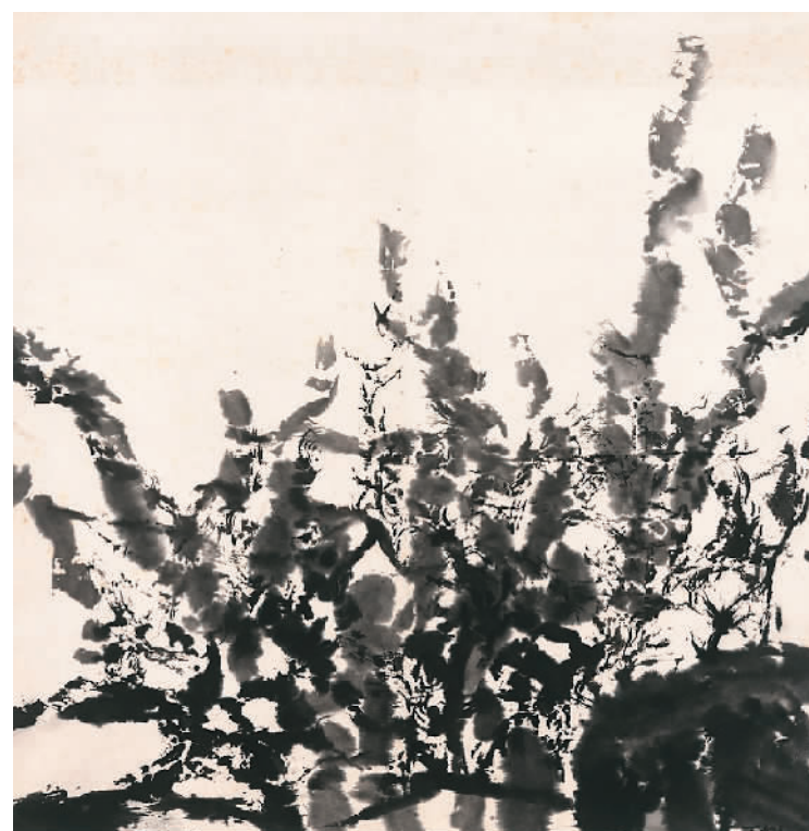
▲ 无题（中国画） 赵无极作 中国美术学院美术馆藏

滚”，赵无极用自己一生的创作回应了老师的期许——游走于东西文化之间，他用自己一生的绘画实践，将中国传统艺术精神与西方现代绘画语言相融合，带回蕴含东方精神、独树一帜的世界性艺术。