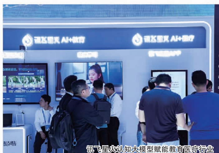
讯飞星火认知大模型赋能教育医疗行业