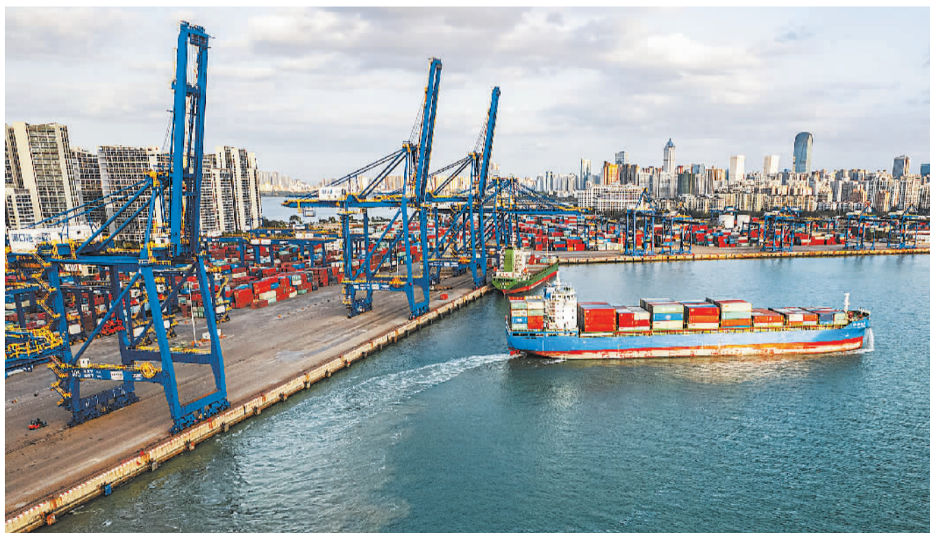
海南省今年出台措施加强对中小微外贸企业金融支持，优化跨境贸易人民币结算环境，助力稳定外贸基本盘。图为海口港集装箱码头。