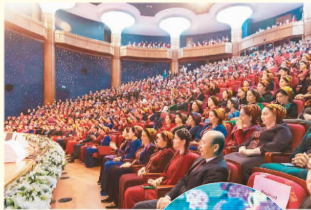
上图：“中国文化年”开幕式暨文艺晚会现场。

中土互办文化年期间，两国艺术家还将相互交流，共同举办各类文化活动，进一步增强两国文化交流与互鉴。