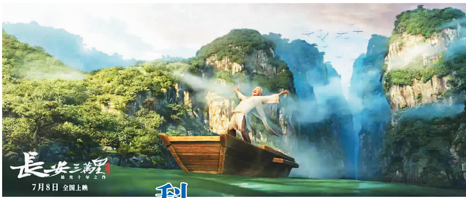
动画电影《长安三万里》以虚拟制作等新技术手段，呈现表现中国独特的诗词意境和韵味。