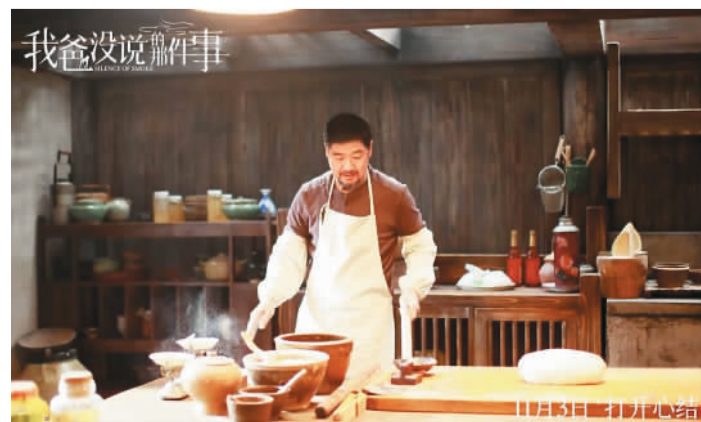
电影《我爸没说的那件事》剧照。

影片故事以剧中人世代坚守/传承百年的传统糕点“冰晶糕”为线索展开，呈现在大银幕上的糕点晶莹剔透，色香味形几近完美，凝聚着民间手艺人智慧和心血，体现了一代代制糕人的匠心。影片赞颂了中国手艺人对于文化遗产和珍贵传统的执著坚守和传承。一些观众观影后表示，影片呈现的父亲深情细腻动人，画面清新美好，音乐扣人心弦，使影片散发着仿佛如柳式“冰晶糕”那般独特的醇香。