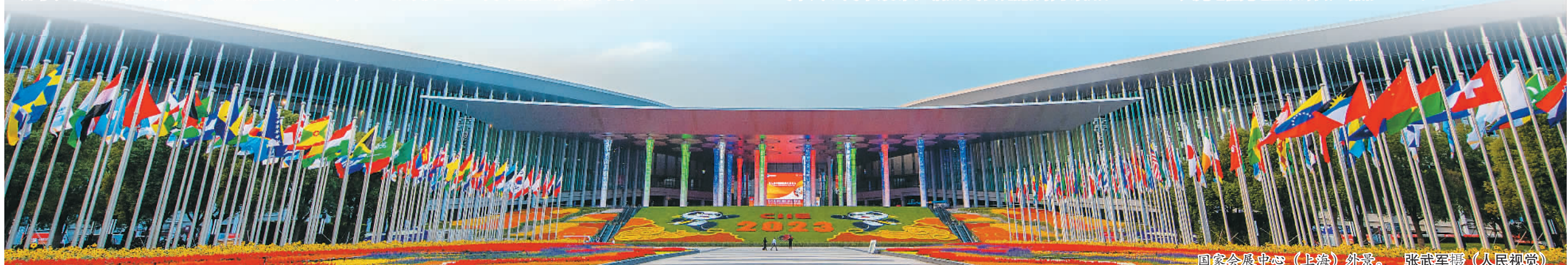
国家会展中心（上海）外景。

办展“绿”，逛展也要“绿”。本届进博会倡导绿色智慧出行，办展期间的保障用公交车全部采用新能源汽车。据国网上海电力测算，第六届进博会期间，国家会展中心（上海）公交充电桩充电量预计比2022年增加88.56%，周边公共充电桩充电量预计同比增加28.82%。