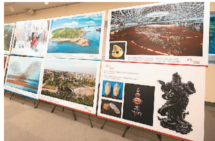
活动现场展出的“山海有情 天辽地宁”辽宁文旅图片。

意义。日中友好会馆理事长小川正史表示，辽宁省从古至今与日本有着非常深厚的交流史。日中友好会馆将继续为加深两国友好关系和人民相互理解而不懈努力。日本政府观光局海外推广部副部长桥本佳宪结合自身多年在沈阳长期工作的经历表示，辽宁浓厚的风土人情让其至今难忘。近一段时间以来，中日两国人员往来逐渐