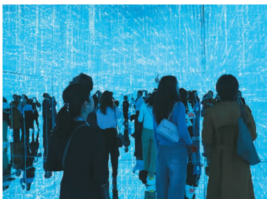
2023年驻华使馆领事官员文旅体验活动现场。

外交部领事司、国家文物局交流合作司、中央广播电视总台国际局以及文化和旅游部部分直属单位、相关文旅企业代表参加活动。