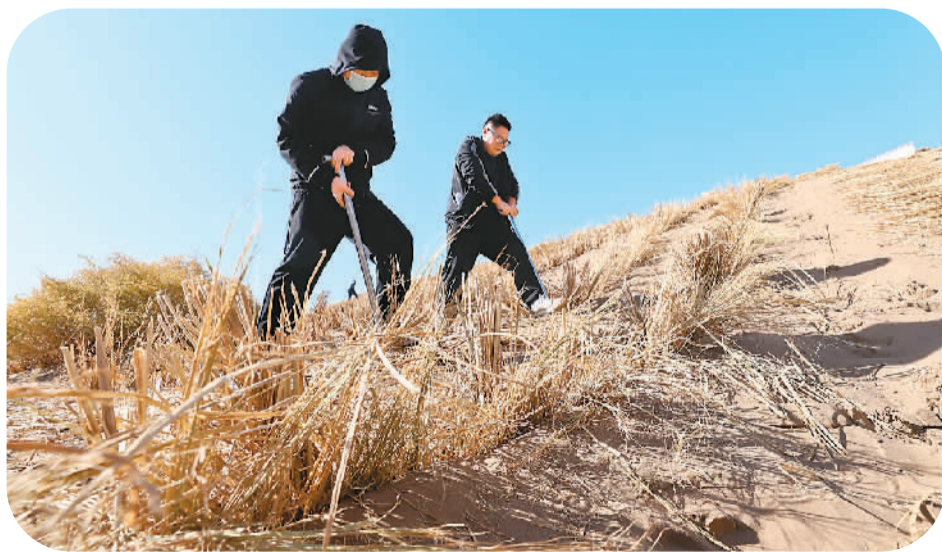
甘肃省张掖市地处河西走廊—塔克拉玛干沙漠边缘阻击战治理区域。日前张掖市秋季防沙治沙林草综合治理项目拉开帷幕，千名市民来到张掖市高台县巴丹吉林沙漠南缘西沙窝风沙口治理区共同义务压沙障。图为两名市民正在压沙障。

在青年文化创新论坛上发布了“世界青年思想状况丛书”和“世界青年文学专刊”全球征集计划，启动了青年文化大使“知行中国”研学计划，鼓励青年深挖文明内涵，勇担文化传承的青春责任。《青年共同行动北京宣言》《青年发展型城市建设深圳倡议》相继发布，旨在更好地促进青年与城市融合发展等。