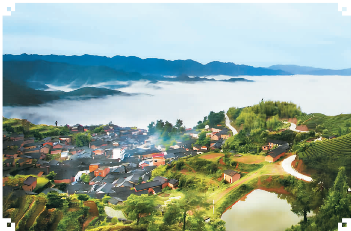
浙江省金华市去年7月启动“百镇共建强基”行动以来，永康市象珠镇携手武义县坦洪乡聚焦各自优势，深耕农文旅融合，依托丰富的山水资源共绘乡村振兴新图景。图为坦洪乡上周村景色。

安理会主席由安理会15个成员国轮流担任，为期1个月。中国上一次担任安理会主席是2022年8月。