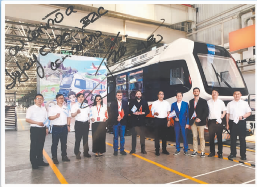
▲中国制造的阿根廷布宜诺斯艾利斯市A线地铁列车。