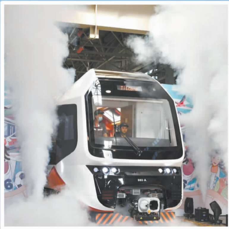
▲2023年6月，中国首次出口阿根廷的新能源轻轨车在中车唐山公司下线。