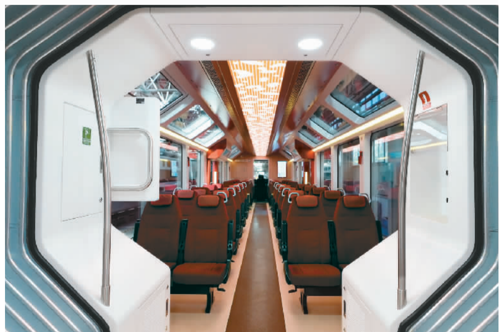
中国出口阿根廷的新能源轻轨车内景。

从输出“中国制造”到输出“中国服务”“中国技术”“中国方案”，“中国造”列车与阿根廷的故事还在延续。