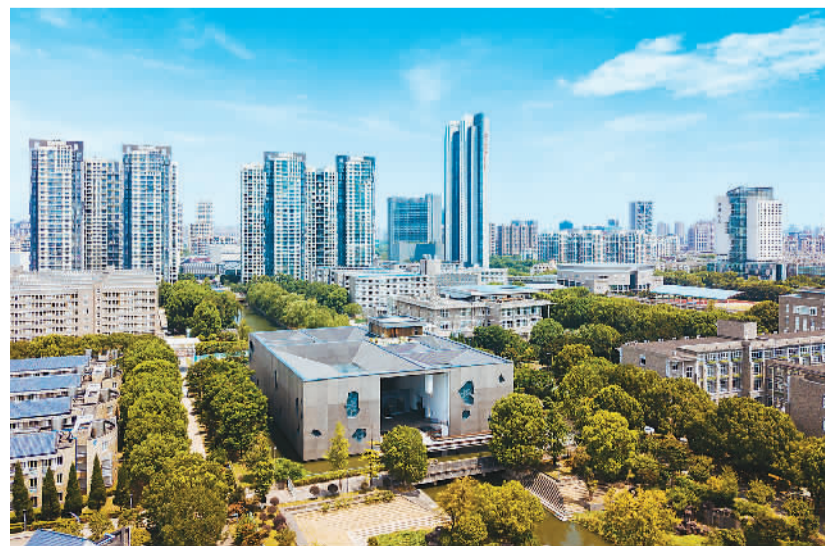
鸟瞰校园。

学生在校的稻田种番薯、胡萝卜,学习种植和农时知识。如今,学校里很多艺术、体育等主题的课外俱乐部,都是中外老师主动发起的。