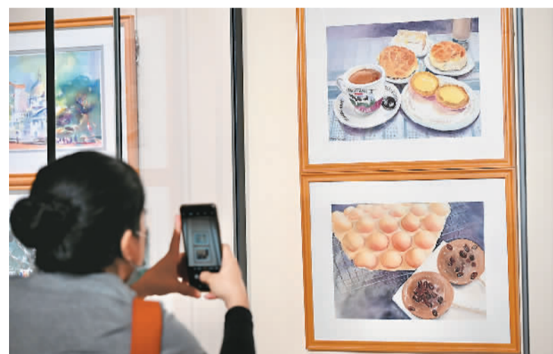
香港一美术馆近日举办“太平景象”展览，展出香港画家联合70名画家共140幅作品，通过油彩、水墨、水粉、钢笔等多种不同艺术媒介描绘香港太平山附近的景象，展现各具特色的香港“太平景象”。

据悉，“京台会”系列活动立足深入贯彻党的二十大精神，深入贯彻党的总体方略，通过讲座、沙龙、对话、展演等，力争打造兼具学术专业性和文化传播力的两岸交流特色品牌。