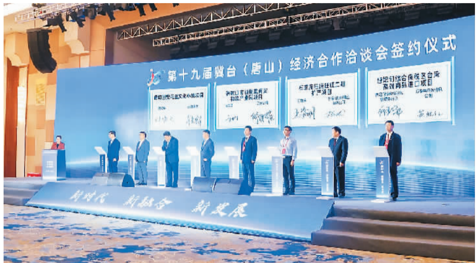
图为冀台会现场，台商投资项目集中签约。

“随着京津冀一体化不断推进，河北将会涌现出越来越多的发展新机，欢迎广大台商台企来河北投资兴业，共同发展。”