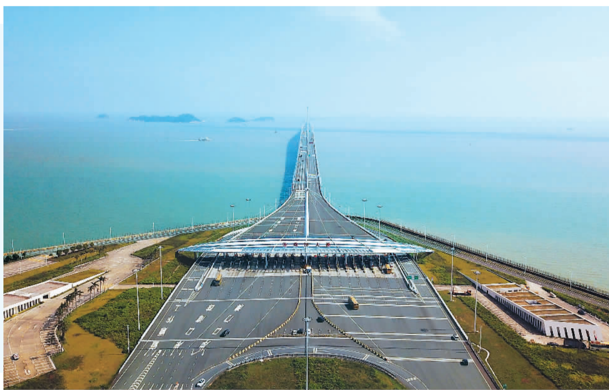
图为港珠澳大桥。

“一国两制”下粤港澳三地首次合作共建的超大型跨海交通工程——港珠澳大桥近日迎来正式通车5周年。