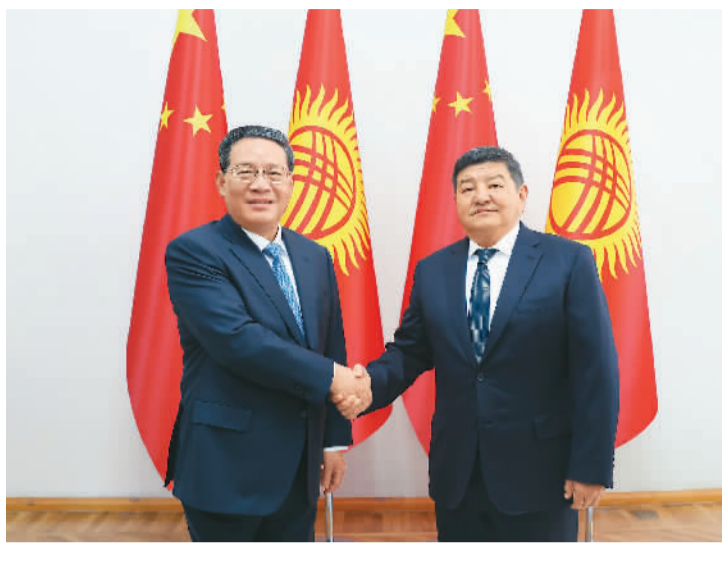
当地时间10月25日上午，国务院总理李强在比什凯克同吉尔吉斯斯坦总理扎帕罗夫会谈。

本报比什凯克10月25日电（记者王迪）当地时间10月25日上午，国务院总理李强在比什凯克同吉尔吉斯斯坦总理扎帕罗夫会谈。