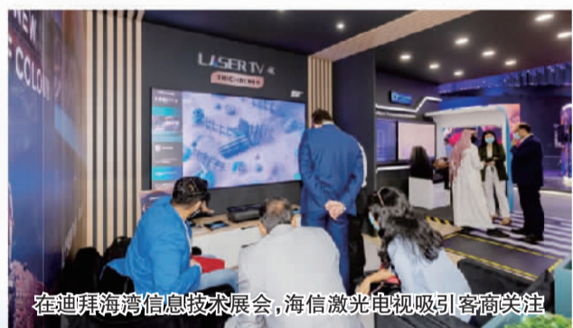
在迪拜海湾信息技术展会，海信激光电视吸引客商关注