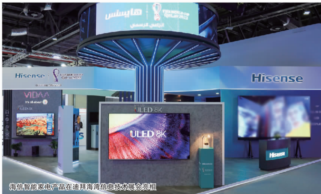
海信智能家电产品在迪拜海湾信息技术展会亮相

继2022年中标埃塞俄比亚智慧公交建设项目后，2023年上半年，海信智慧高速、信号系统完成首