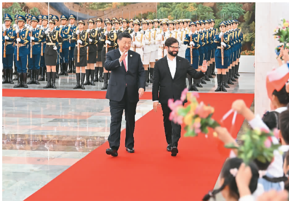
10月17日上午,国家主席习近平在北京人民大会堂同来华出席第三届“一带一路”国际合作高峰论坛并进行国事访问的智利总统博里奇举行会谈。会谈前,习近平在人民大会堂北大厅为博里奇举行欢迎仪式。

新华社北京10月17日电(记者孙奕、吉宁)10月17日上午,国家主席习近平在人民大会堂同来华出席第三届“一带一路”国际合作高峰论坛并进行国事访问的智利总统博里奇举行会谈。 习近平指出,智利是第一个同新