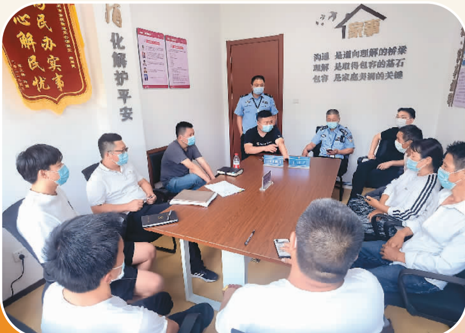
余杭街道警网联合调解。