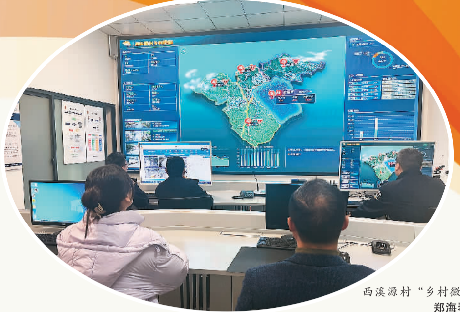
西溪源村“乡村微脑”。

过程中，通过数字化，让数据成为发现矛盾、解决矛盾的好手段。走进余杭区数“智”治理中心，工作人员紧张地忙碌着，大屏上“余智护杭”应用全景展示着全区的情况，包括地图、摄像头点位、房屋数量、人口等。有矛盾纠纷发生时，数“智”中心就是指挥“大脑”，调动各种资源，第一时间解决，快速而又精准，令人印象深刻。利用数字化手段发现和解决矛盾，余杭区有很多故事。