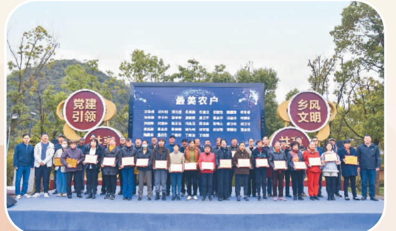
西溪源村以“100+X”积分为依据评选最美农户。