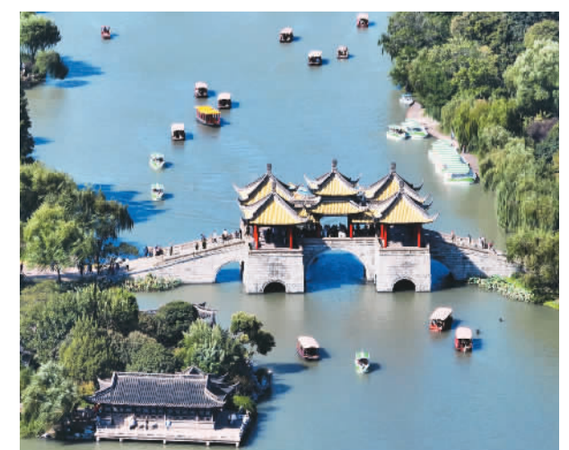
中秋国庆假期期间，江苏省扬州市瘦西湖风景区秋色宜人，游人如织。